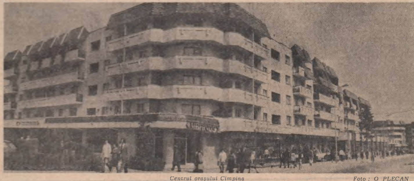
Centrul orașului Cîmpina