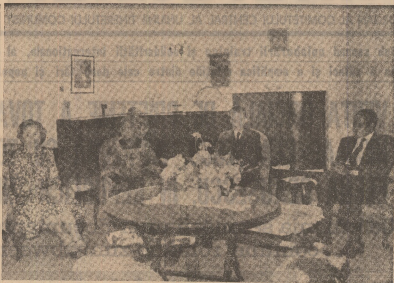
Sîmbătă au continuat

Relevînd identitatea sau apropierea punctelor de vedere în legătură cu problemele discutate, tovarășii Nicolae Ceaușescu și Robert Gabriel Mugabe au reafirmat voința României și Republicii Zimbabwe de a conlucra tot mai strîns în cadrul O.N.U. și al altor foruri internaționale, în interesul cauzei păcii, destinderii, înțelegerii și cooperării internaționale.