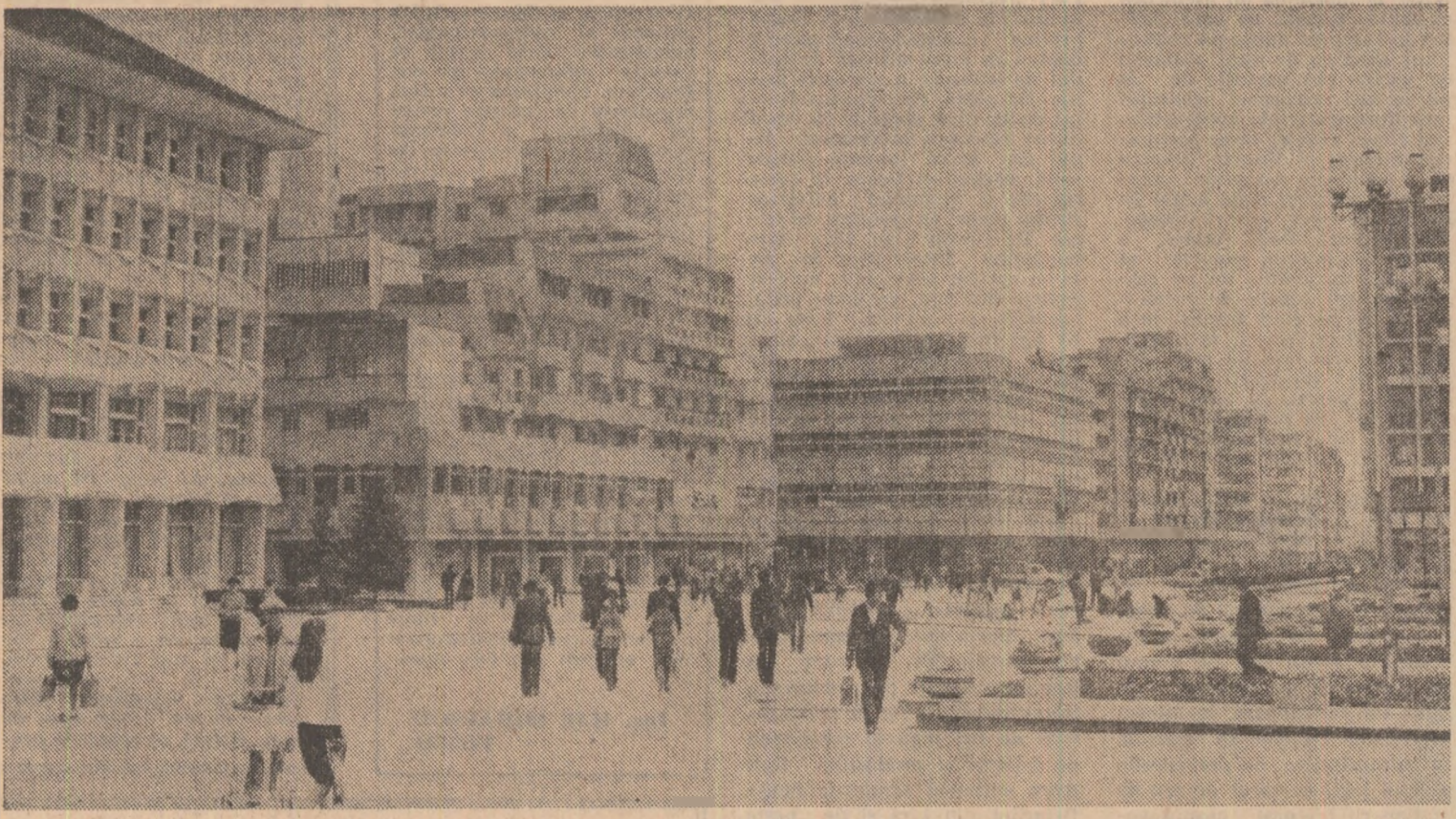
Centrul municipiului Tirgoviste

GEORGE CIUCU adjunct al ministrului educației și învățământului (Continuare în pag. a 11-a)