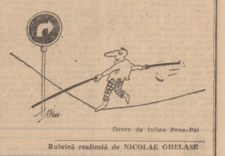
Rubrică realizată de NICOLAE GHELASE