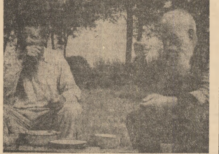
Ploștirea oameni al Deltii