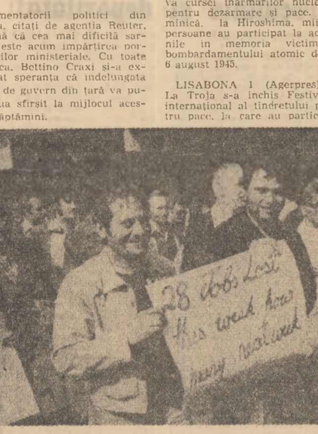
Tineri austrieci demonstrînd împotriva concedierilor, pentru crearea unor noi locuri de muncă

LISABONA 1 (Agerpres). — La Troja s-a închis Festivalul internațional al tineretului pentru pace, la care a participat