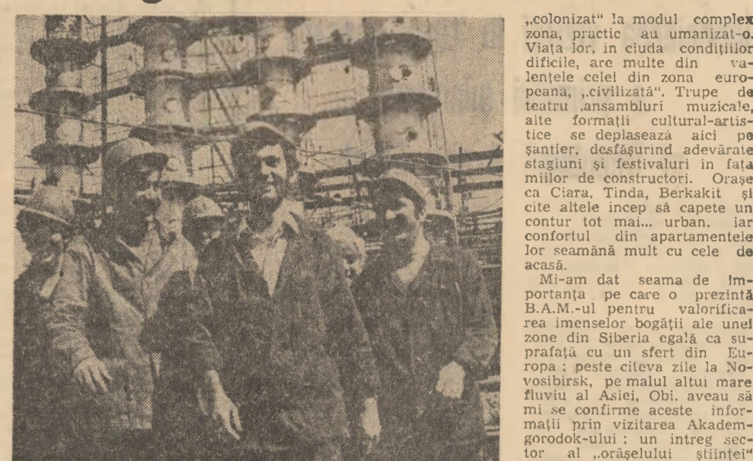
„Boris” — un intranzigent al „orașului științei” este afectat exclusiv construcției B.A.M.-ului și valorificării zonei sale de influență.

STOCKHOLM 1 (Agerpres). — La Göteborg s-a deschis al 22-lea Congres al Ligii internaționale a femeilor pentru pace. În cadrul congresului vor avea loc dezbateri privind rolul și locul femeii în lupta pentru pace și dezarmare, pentru printimpinarea unui război nuclear. BONN 1 (Agerpres). — Peste 500 de membri ale mișcării pentru pace din R.F.G. au organizat în zona masivului Hunsrück (Germania-Vest-Pfalz), unde se prevede amplasarea rachetelor nucleare cu rază medie de acțiune, o demonstrație de protest împotriva planurilor N.A.T.O. de a începe desfășurarea rachetelor respective în toamna acestui an. Participanții la demonstrație au cerut guvernului federal al R.F.G. să renunțe la planurile de transformare a teritoriului țării într-o rampă de lansare pentru rachete „Cruise” și „Pershing 2”.