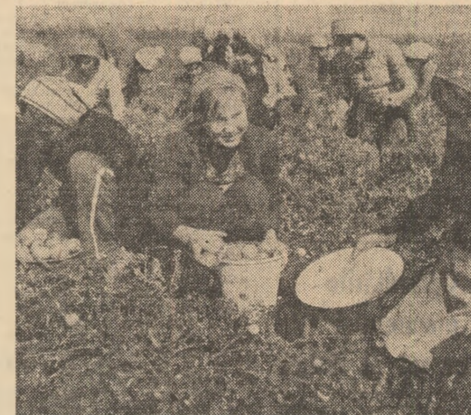
Zile pline de lucru în grădina de legume ale județului Giurgiu, prin prezența tinerilor la cules