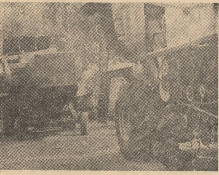
PREGATIREA UTILAJELOR PENTRU CAMPANIA DE TOAMNA