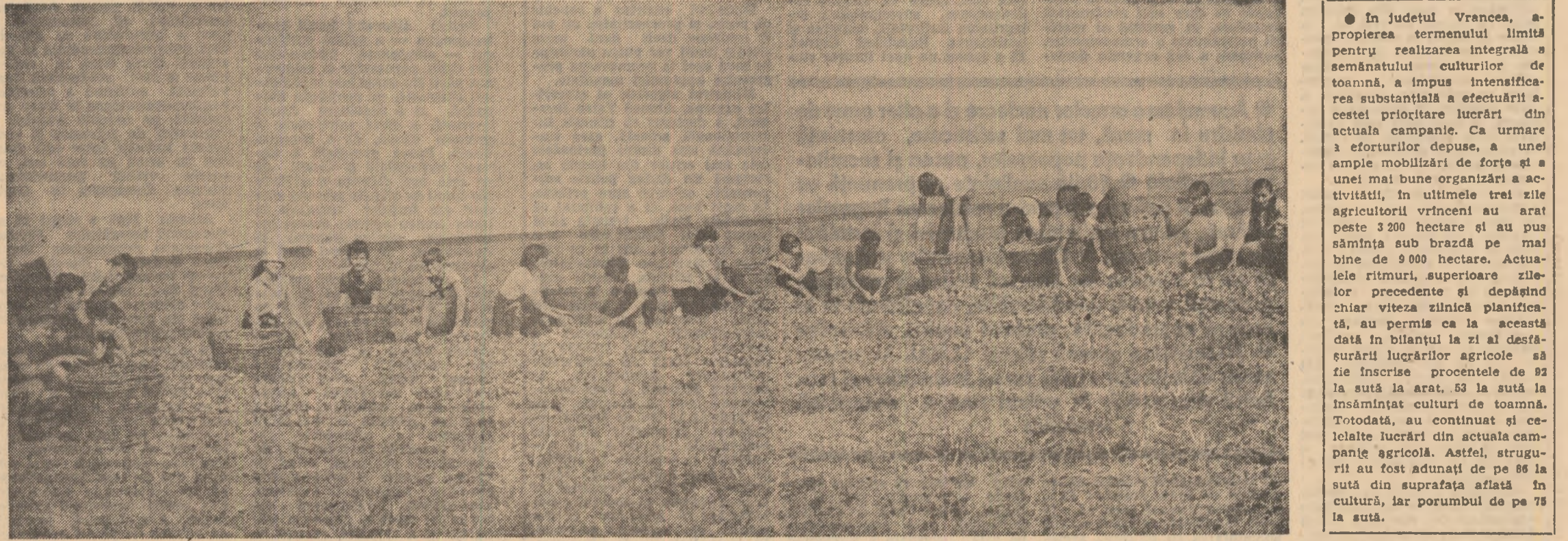
Brigăzile uteciste în livezile clujene. În fundal, mecanizatorul Vasile Buncă lucrează la semănatul grâului.