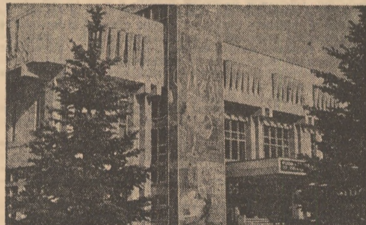
Casa științei și tehnicii din Cimpina.