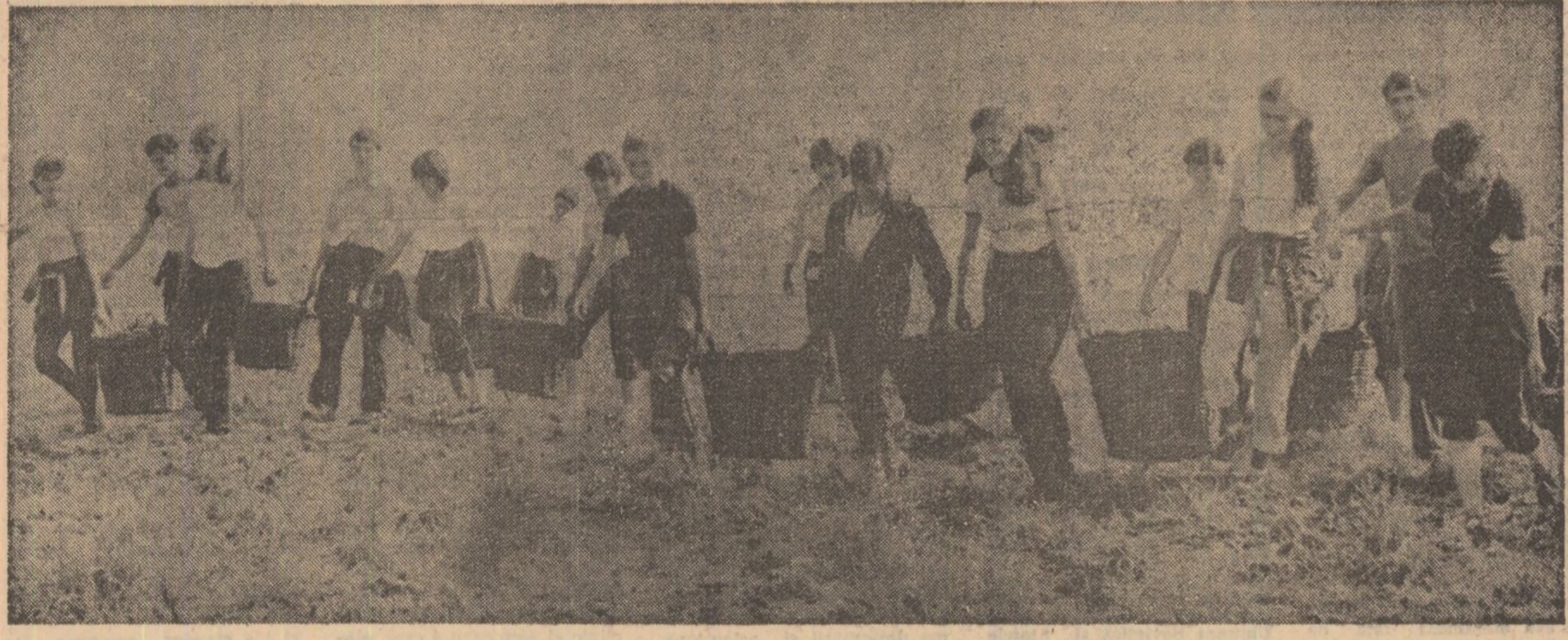
Elevii ai Liceului de matematică și fizică din Roman în practică la Asociația Legumicolă din Nisiporești, județul Neamț.