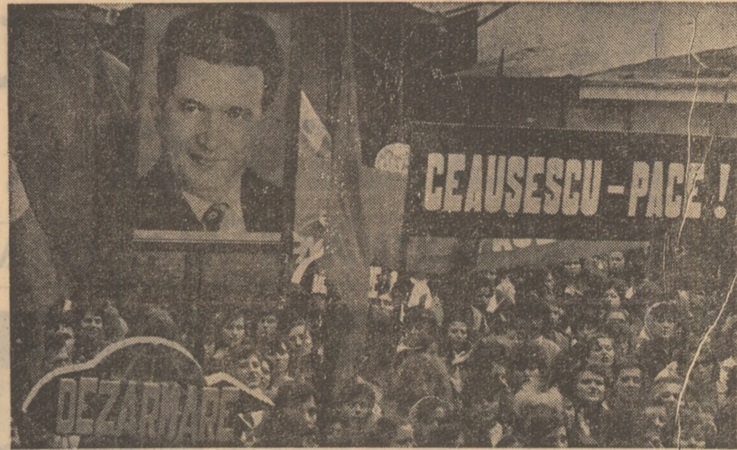
UNANIMĂ ȘI FIERBİNTE ADEZIUNE A TUTUROR FIILOR PĂTRII LA ÎNFLĂCĂRĂTELE CHEMĂRI ALE TOVARĂȘULUI NICOLAE CEAUSescu, LA APELUL FRONTULUI DEMOCRAȚIEI ȘI UNITĂȚII SOCIALISTE MARI ADUNĂRI ALE OAMENILOR MUNCII PENTRU PACE ȘI DEZARMARE