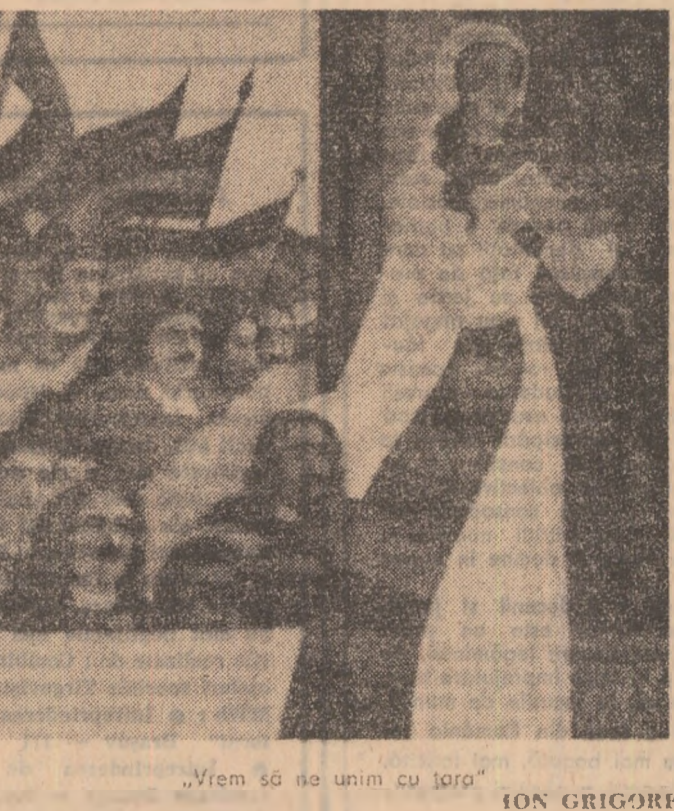
„Vrem să ne unim cu țara” ȘTEFAN CICIO POP

Marele Sfat Național a hotărât în ședința din 7/20 noiembrie să convoace Adunarea Națională a națiunii române din Ardeal, Banat și Tara Ungurească. Locul cel mai potrivit pentru această adunare este Alba Iulia, această Mecă a românismului, unde zăc masele celorlalte mari mari martiri ai noștri: Horea, Cloșca și Crișan, loc sfânt pentru întreaga suflare românească. Fraților, acestea sînt momente înălțătoare, istorice și cine ar putea găsi cuvinte care să zugrăvească tablourile ce le vedem și interpretăm sentimentele ce le avem?”