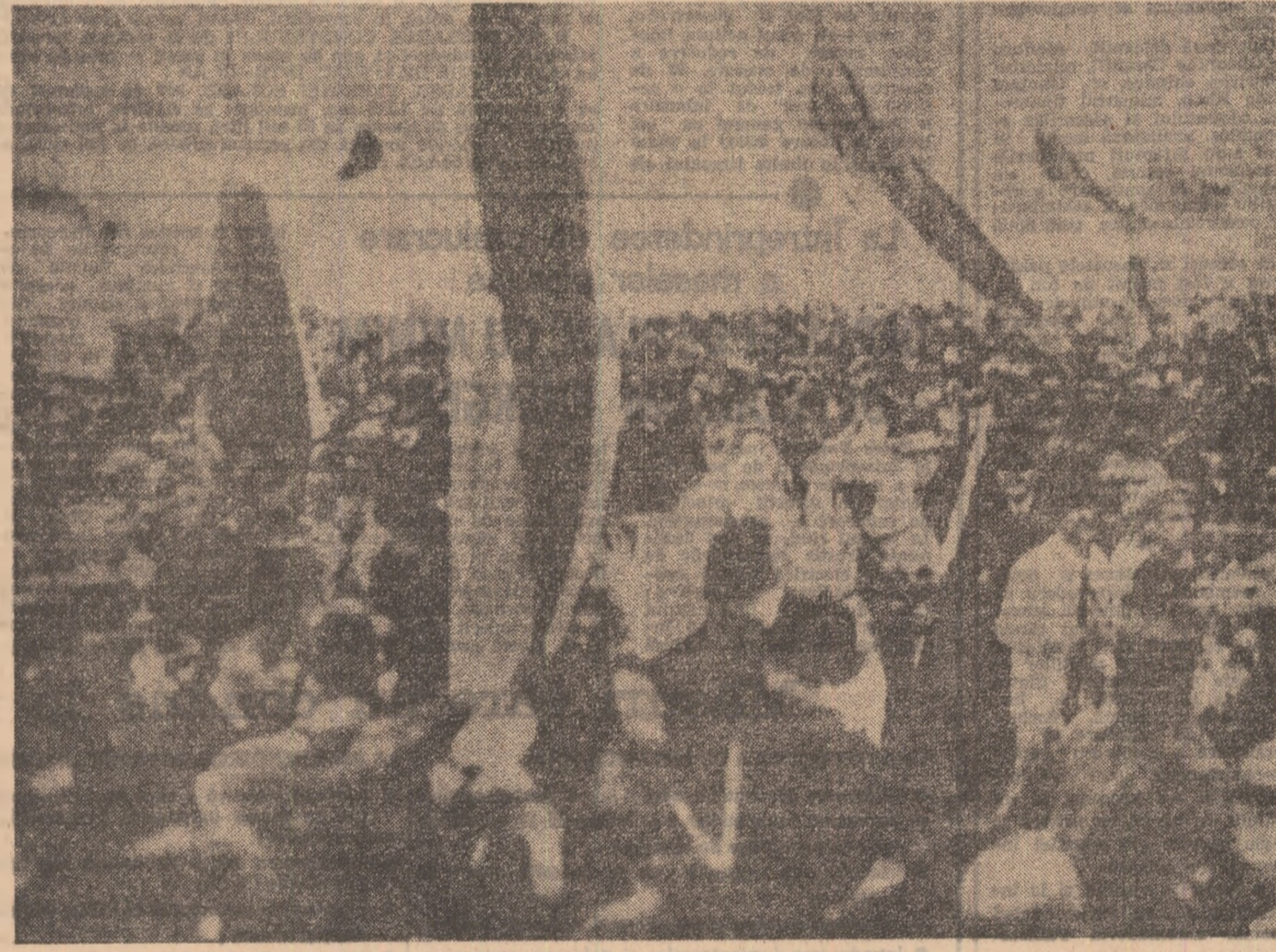
ONORATA ADUNARE GENERALA NAȚIONALĂ