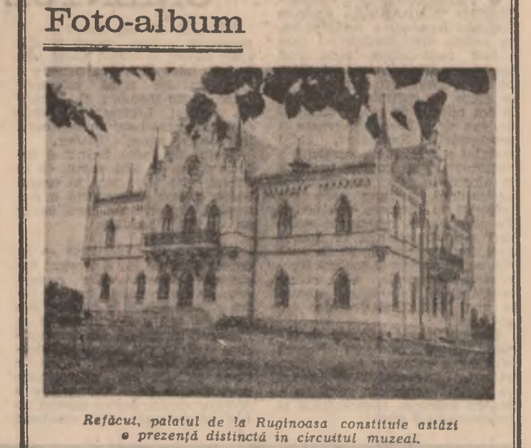
Refacut, palatul de la Ruginoasa constituie astăzi o prăvălie distinctă în circuitul muzeal.

NICOLAE MILITARU CĂTĂLIN BORDEIANU