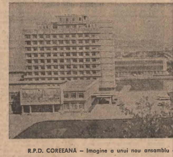
R.P.D. COREEANĂ — Imagine a unui nou ansamblu arhitectonic din orașul Weunsan

Furniza 15 miliarde KWh anual, numai 0,7 miliarde din potențial este valorificat, în prezent. Experții au apreciat, totodată, că aproape o treime din populația lumii beneficiază de avantajele electricității. Declajele în acest domeniu între țările occidentale industrializate și cele în curs de dezvoltare, aparținând de acest secol, limitele raționale. Astfel, un nord-american consumă de peste 80 de ori mai multă energie decât un african, iar Suedia, în cadrul simpozionului s-a referit la avantajele beneficiarilor din țările în dezvoltare, care beneficiază de o rată de consum de energie de 750 milioane.