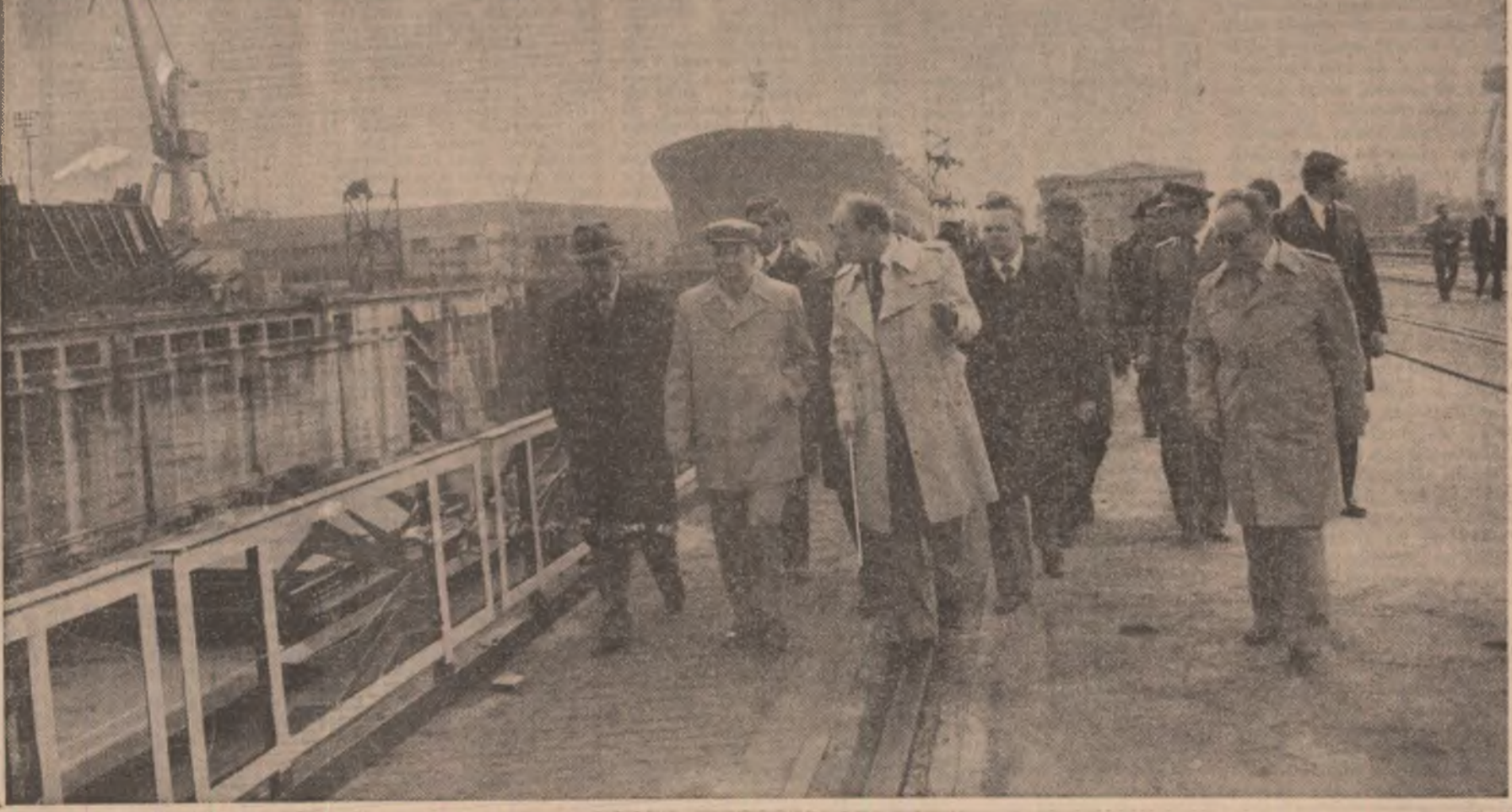
Impresionează, deopotrivă, elucezile, complexe zidiri hidrotehnice, adevărate porți ale sistemului de navigație, porturile industriale, comerciale și pentru călători...