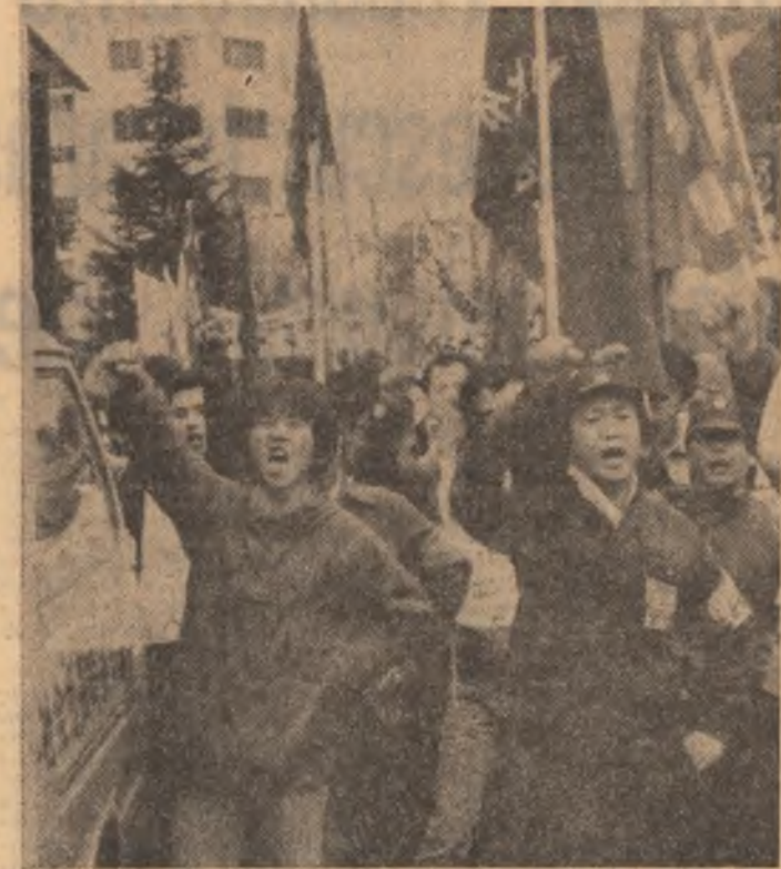
Imagine din timpul unei demonstrații desfășurate în portul nipon Sasebo împotriva planurilor S.U.A. de a doua încep de la 1 iunie navele americane staționate în porturile japoneze cu rachete nucleare de tip „Tomhawk”.

Prima parte a sesiunii din acest an a fost marcată pentru delegația țării noastre de responsabilitatea ce i-a revenit prin asigurarea prezidenției lunare conferinței în luna martie. În exercitarea acestei funcții, delegația română a înscris pe ordinea sa de zi o serie de probleme esențiale legate de încetarea cursului înarmării și dezarmare.