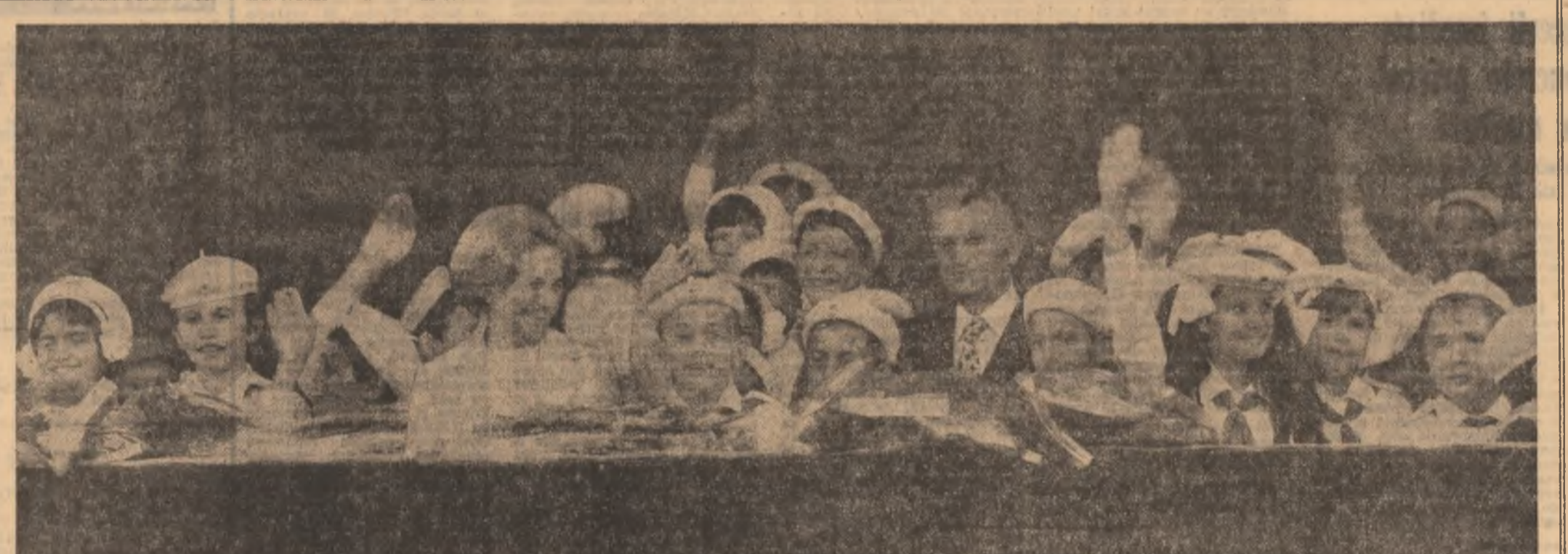
„Organizația de Pionieri este o valoroasă școală de plămădire a celor mai nobile trăsături morale ale personalității: cinstea, demnitatea, respectul față de muncă, mîndria patriotică, spiritul internaționalist, generozitatea și dăruirea pentru interesele poporului, exigența și spiritul revoluționar, comunist“.