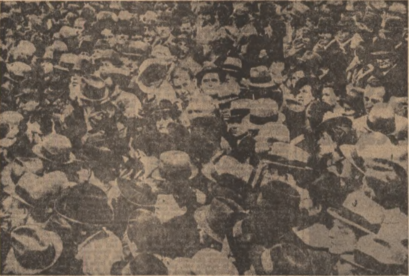
1 Mai 1939 la București

Realizarea unității statului național român în urma acelor plebiscite din 1918, eveniment de importanță crucială în istoria poporului român, a creat cadrul național și socio-economic în care s-au desfășurat o serie de reforme menite să înscrie țara pe traiectoria dezvoltării moderne. Distracția acestei unități către Conferința de pace de la Paris din 1919 — 1920 l-a dat o recunoaștere internațională și o consacrare de drept, a constituit o problemă vitală a României interbelice, a preocupat majoritatea covârșitoare a poporului român. Constituția adoptată în 1923 proclama România stat independent, suveran și unitar. Politica externă interbelică a guvernului ce s-a succedat la cîrmă țării a avut ca preocupare centrală menținerea și consolidarea statului teritorial, obiectiv a cărui realizare devenea posibilă numai în condițiile unei stări de pace.