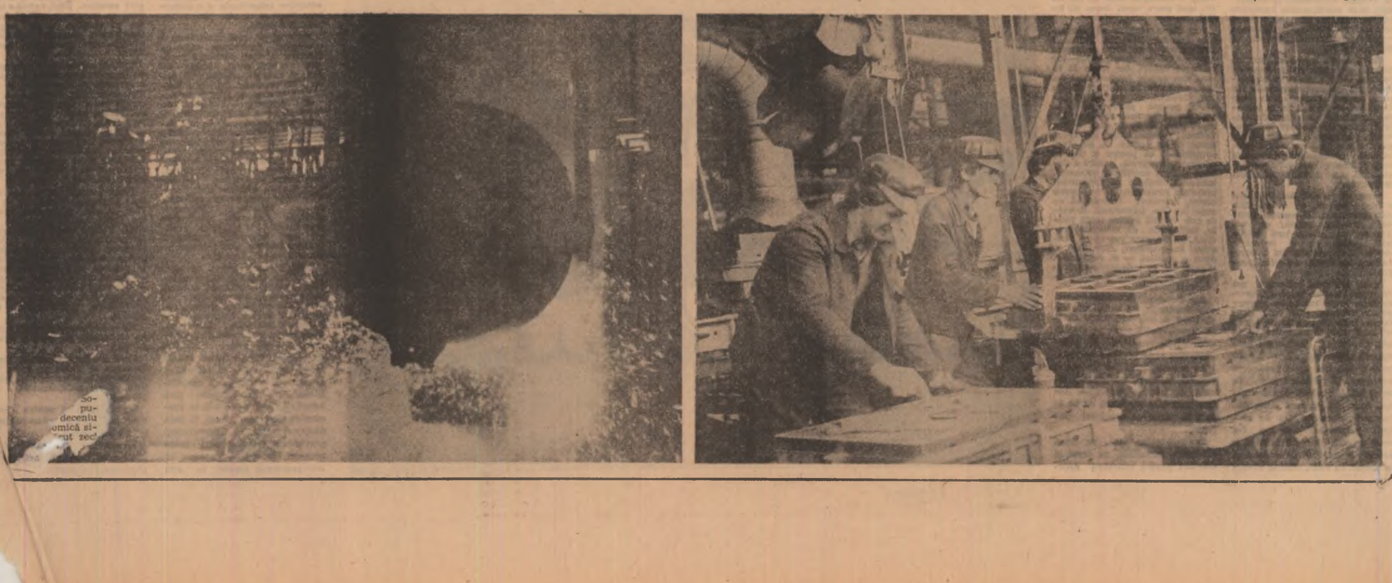
Pagină realizată de MIRCEA BORDA, CONSTANTIN STAN și GHEORGHE CUCU