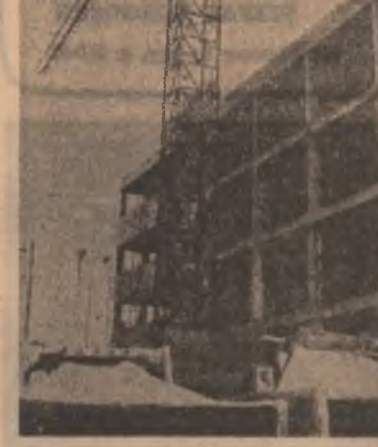
Evident, constructorii și-au făcut cu prioritate datoria (foto 1), montorii țes și ei tot ce pot, atunci cînd au ocazia (foto 2), numai că, mai bine de 50 de diverse utilajele nici pînă acum nu au sosit pe șantier (foto 3).

întîrzierii revine beneficiarului... — Așa, înclt, ne permitem să obiectivăm, vă obliga în primul rînd pe dumneavoastră la eforturi susținute pentru recuperarea întîrzierilor, pentru recuperarea promptă a amplasamentelor, pentru asigurarea ritmică a utilajelor. — În linii mari (!) am asigurat la timp amplasamentele stabilite, mai puțin cele pentru ultimele două cazane ale centralei termice (care nu sînt deloc ait de lipsite de importanță cum ni s-a sugerat, dimpotrivă, spre ele impuneră-se să se concentreze eforturile în perioada imediat următoare, n.m.). Privitor la utilajele, în cea mai mare parte le-am pus la dispoziția montorilor, însă, într-adevăr, cele care lipsesc acum condiționează punerea în funcțiune. Not am mai luat legătura cu furnizorul restant — respectiv întreprinderea de utilaj chimie Făgăraș, chiar astăzi directorul nostru este acolo pentru a impulsiona livrarea unor utilajele, dar, adevărul acesta este, situația că, fiind vorba de o cantitate mică de utilaje, printre-om muncă mobilizată, furnizorul ne-ar putea sprijini cel pu-