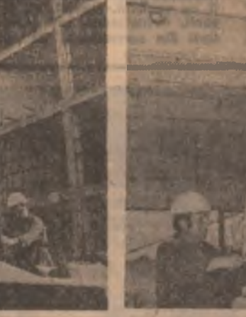
lin pentru punerea în funcțiune parțială, în proporție de 50 la sută, a nollor obiective.