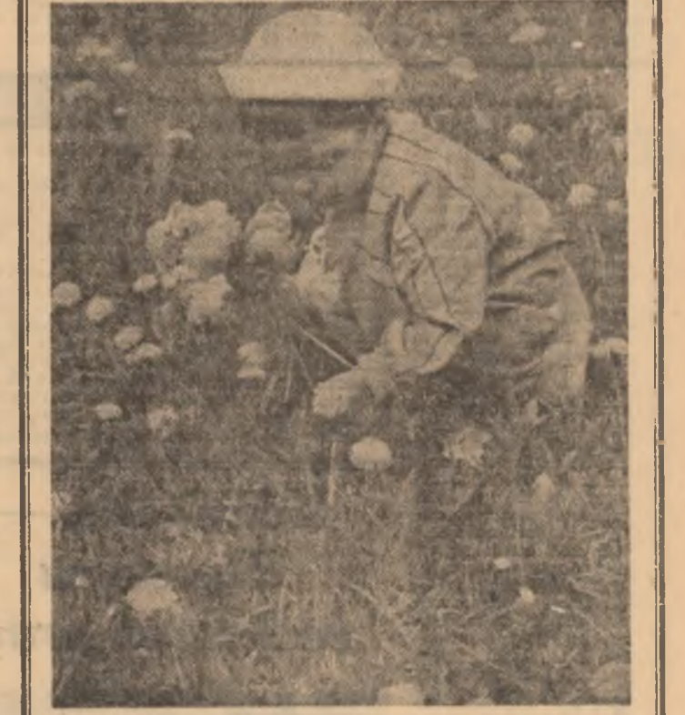
A înflorit păpădia!