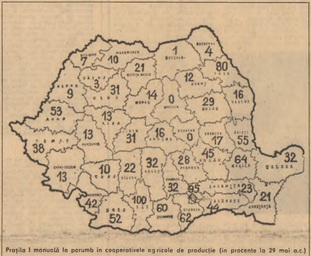
Prășila I manuală la porumb în cooperativele agricole de producție (în procente la 29 mai a.c.)

● Evoluția excelentă a vremii din această perioadă asigură o puternică dezvoltare vegetativă a culturilor prașitoare dar și a buruienilor ● Prin toate mijloacele disponibile să se acționeze în ritm intens la efectuarea prașilelor, manuale și mecanice, organizându-se exemplar munca pe toată durata zilei și pe toate suprafețele ● Acum, nu există nici o justificare în ce privește aminarea lucrărilor de întreținere ● Experiența unităților frunțase evidențiază că recolte mari se realizează numai aplicând 3-4 prașile corect și la timp, menținându-se densitățile prevăzute în normele agrotehnice ● În raport cu rezerva de umiditate, mai ales în grădini și pe suprafețele cultivate cu furaj să se procedeze la aplicarea udărilor ● Imediat după recoltarea nutrețurilor să se treacă la însămișterea suprafețelor cu a doua cultură.