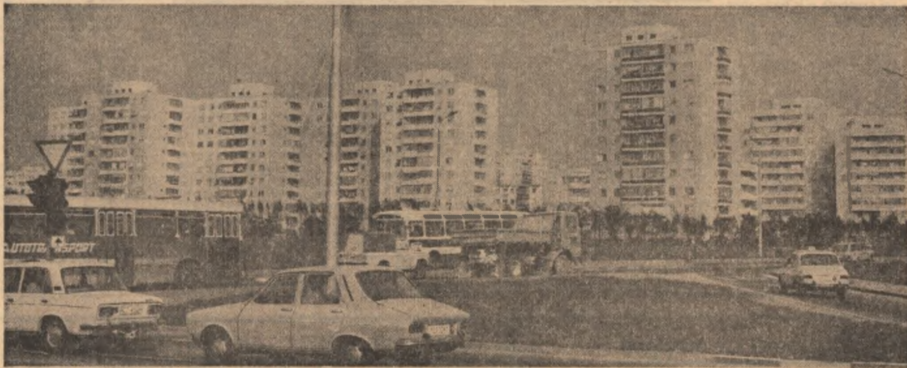
Constanța — în plin sezon estival