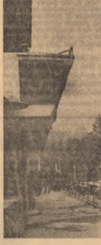
Stațiunea Olănești, una din cele două stațiuni balneo-climaterice din țara noastră