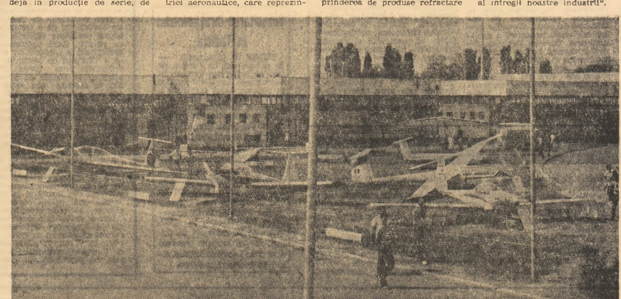
Grupaj realizat de EMERIC SZEKELY