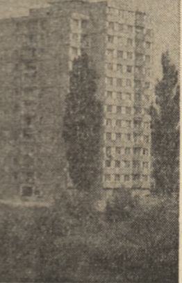
R. S. CEHOSLOVACIA — Imagine din Pardubice, oraș aflat în plină dezvoltare și modernizare

de obicei nu s-a așezat încă în rândul celor care au o semnificație aparte, tendința de vedere că în 1984 începând de la 77 la 1987, în prezent, dar mai târziu în viața internațională a crescut continuu, țările în curs de dezvoltare afirmându-se în tot acest timp ca factor activ și creator în procesul restaurării raporturilor economice internaționale.