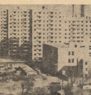
Insemnări din R.P. Chineze