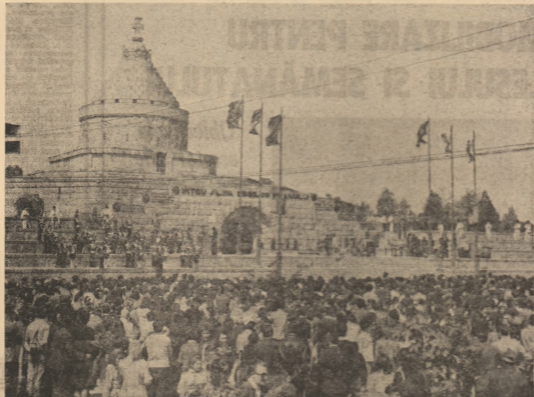
„Marea Unire“ din Alba Iulia, 1 decembrie 1983. În fața clădirii Muzeului Unirii, tinerii din Alba Iulia au sărbătorit ziua de 65 de ani de la Marea Unire.

Tinerii — față în față cu istoria. O imagine am putea spune celtădană. Pionieri, elevi, tineri muncitori, țărani, intelectuali — îi întâlnim în orice vizită la vechile încălțări de istorie neamului, în orice sală de muzeu sau de expoziție. Contactul permanent al celei mai tinere generații a țării cu istoria patriei este răspunsul direct, concret al organizațiilor noastre revoluționare la înaltele exigențe formulate de secretarul general al partidului, tovarășul Nicolae Ceaușescu, privind creșterea forței penetrante în conștiința tinerilor a faptelor de jertfă și eroism ale înaintașilor noștri, consolidarea, și în acest mod, a înaltelor trăsături morale proprii comunistului, omului nou.