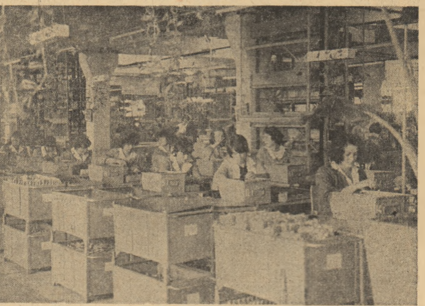
Întreprinderea „Electrocontact” Botosani