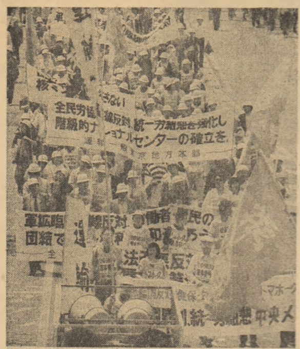
JAPONIA: Aspect din timpul unei ample demonstrații în favoarea dezarmării și păcii desfășurate la Tokio