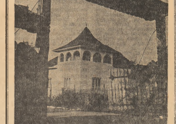
Lumina, ca o poartă deschisă