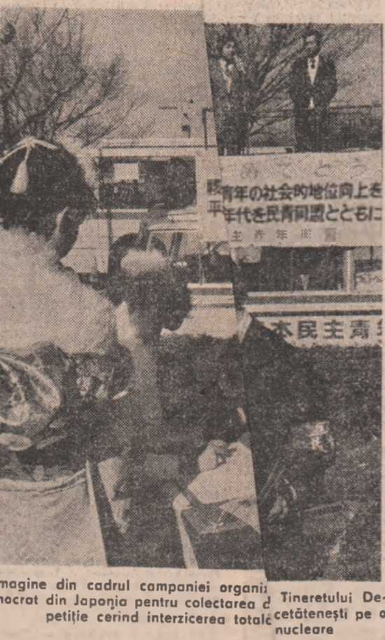
Imagine din cadrul campaniei organizate de Tineretul Democrat pentru colectarea de semnături pentru interzicerea totală a armelor nucleare