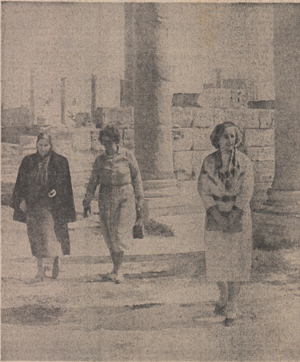
Tovarășă Elena Ceaușescu a vizitat, în cursul dimineții de marți, vestigiile feniciene și greco-romane ale orașului antic Sabratha. Elena Ceaușescu sentimentele de grațitudine pentru onoarea ce li s-a făcut prin această vizită. Au fost prezentate cu acest prilej vestigiile de la Sabratha și omenii de știință libieni pentru ocrotirea acestor mari valori istorice de pe cuprinsul orașului antic Sabratha.