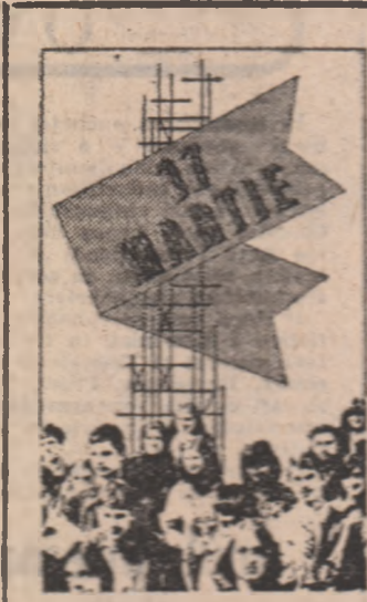
O sută largă de acțiuni politico-educative și cultural-artistice este organizată, în continuare, apăsătorii alegeri de deputați. Într-un interes profund manifestat de cetățenii țării față de marile evenimente de la 17 mar-

După cum ne comunică Institutul de meteorologie și hidrologie, între 7—10 martie, vremea va fi în general călduță, mai ales în prima parte a intervalului, cu aerul temperat și noros. Văz căzând precipitații slab care racter local în toate regiunile, în nord-vestul țării acestea fiind mai ales sub formă de ninsoa-