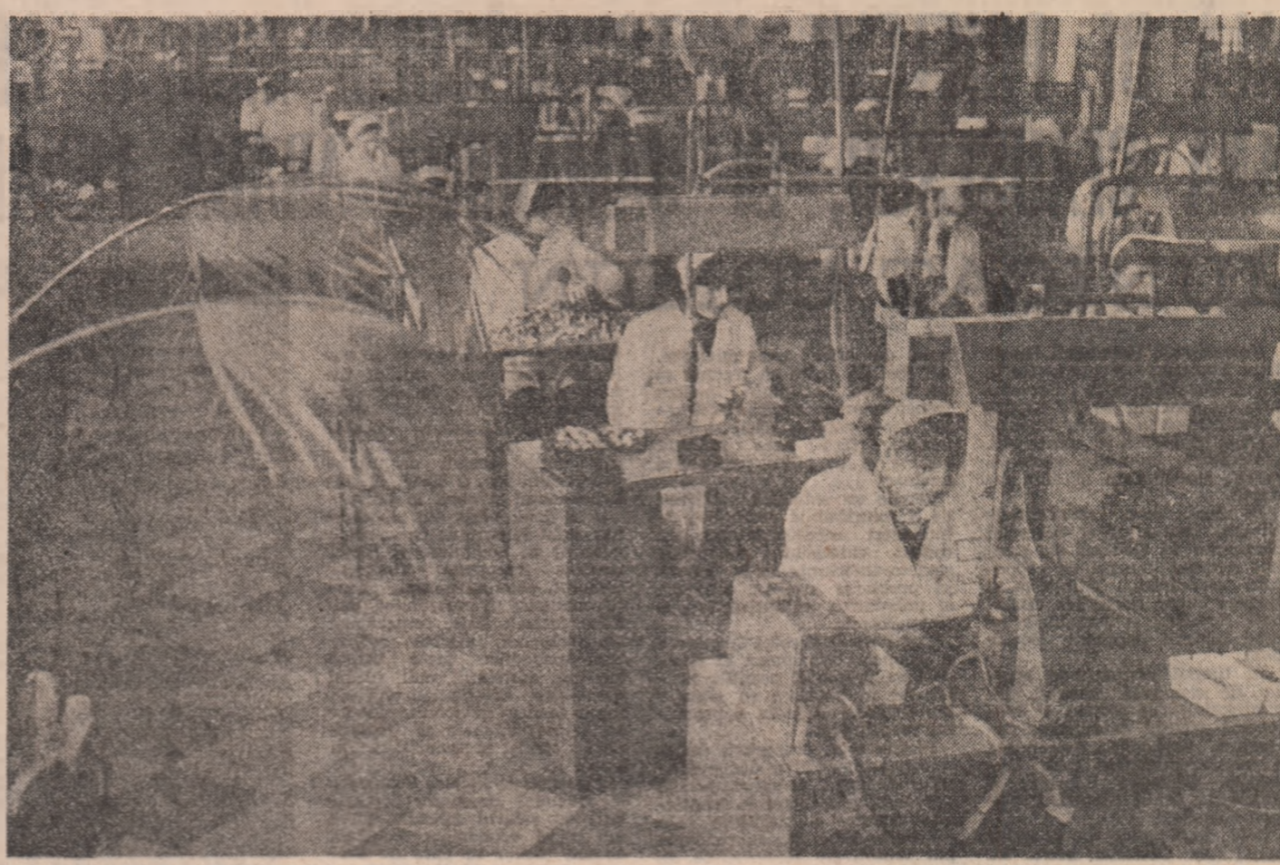
(Urmasare din pag. 1)