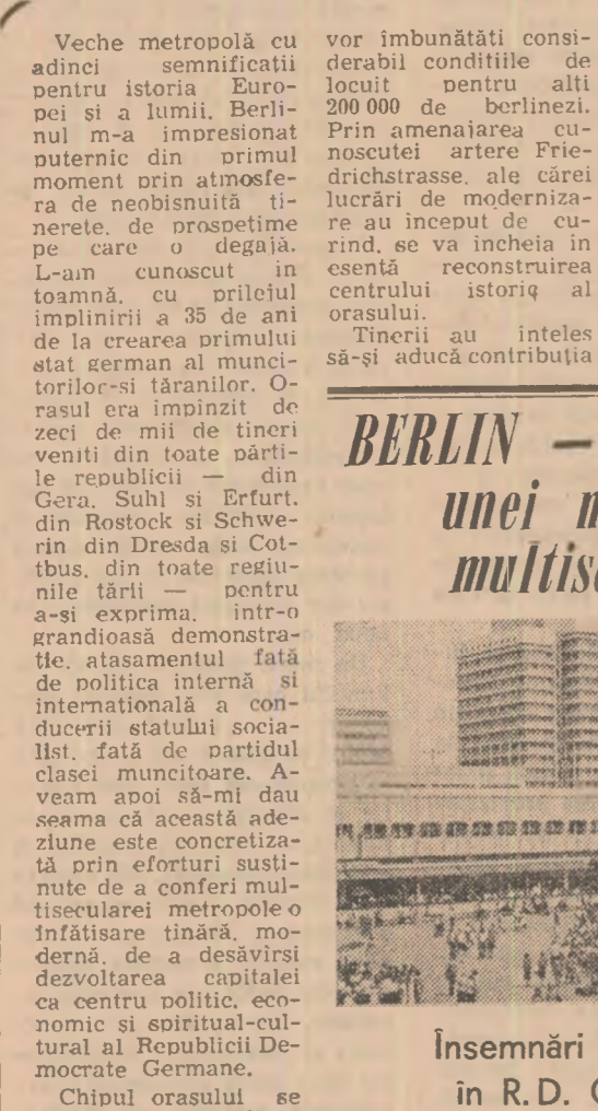
BERLIN - Dinamismul unei metropole multiseculare