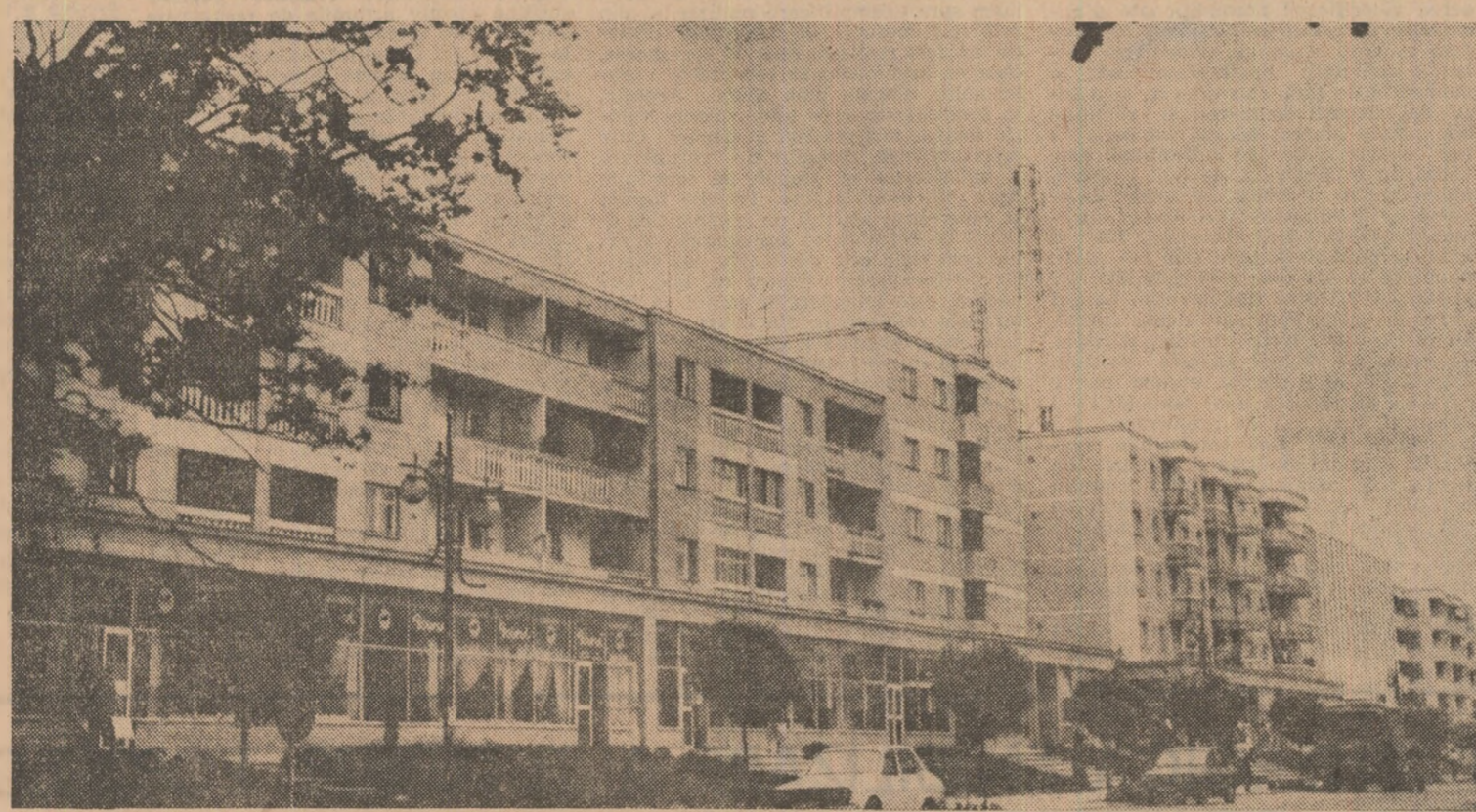
Noua imagine a Caracalului

Puterile colective ale COMBINATULUI MINIER PLOIEȘTI a raportat un succes deosebit: extragerea, de la începutul anului și pînă în prezent, a unei cantități de două milioane tone de cărbune. Minerii acestui mari unități, ocupanți a locului III pe primele două etape ale trecerii la socialism, se desfașoară în industria carboniferă, înregistrează un spor la producția zilnică de circa 1500 tone lînit, fapt ce le va permite să îndeplinească planul pe primul semestru al anului cu mult timp înainte de termen. În această deosebire la obținerea acestui rezultat prestigios și-au adus-o oamenii muncii de la mina Filipești de Pădure, Județul Prahova, minerii întreprinderii de profil Cimpulung, Județul Argeș, care au extras pînă în prezent, în total, circa 5000 tone de cărbune, și cei de la mina Sotînga, Județul Dimbovîța.