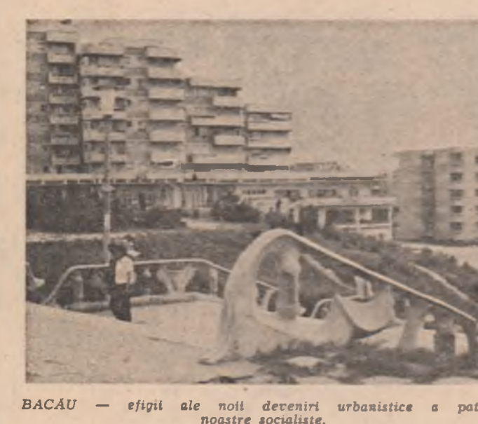
BACĂU — eșifii ale noii devenirii urbanistice a patriei noastre socialiste.