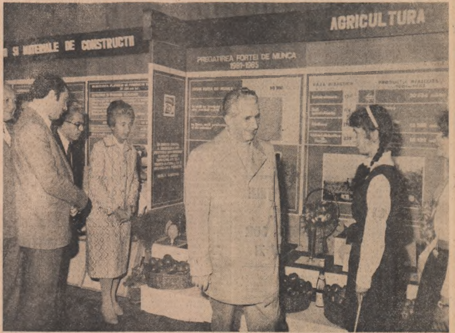
(Continuare din pag. 1)

în prezent pe această modernă platformă industrială — piese grele turnate din oțel și fontă, utilaje pentru metalurgie, chiavete sau industria mimeră — se situează la cel mai înalt nivel al tehnicii actuale.