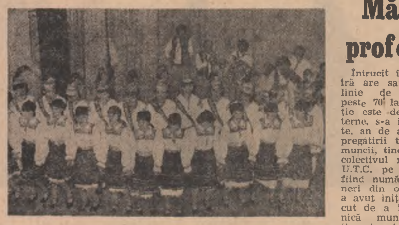
Ansamblul de dansuri al Căminului cultural Peceoa — Arad