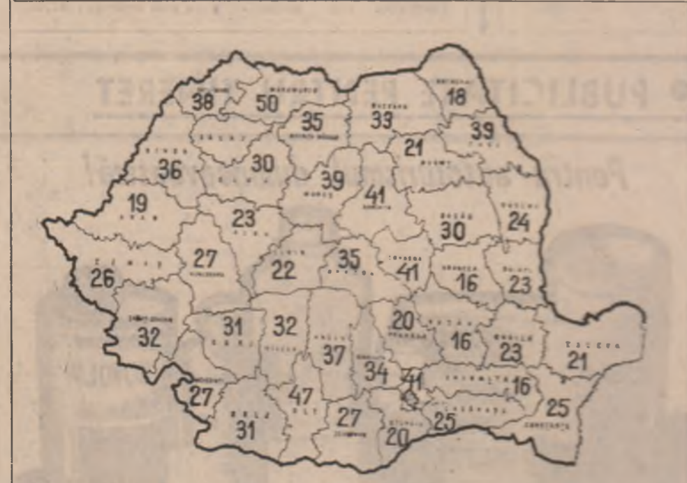
Stadiul însămînțării la culturile de toamnă, total sector socialist (în procente) la data de 23.09.1985