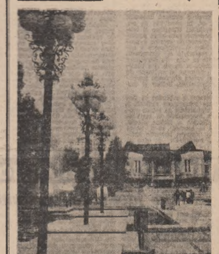
...Lumină de toamnă!