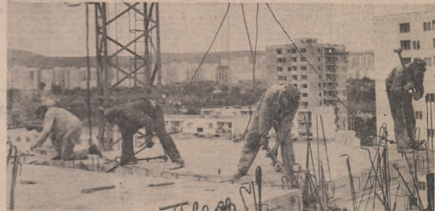
Cartierul Mănaștur — Cluj-Napoca