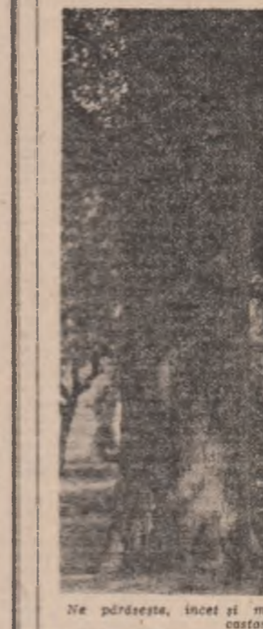
Ne părăsește, încet și melancolic, umbra subțire a castanilor!