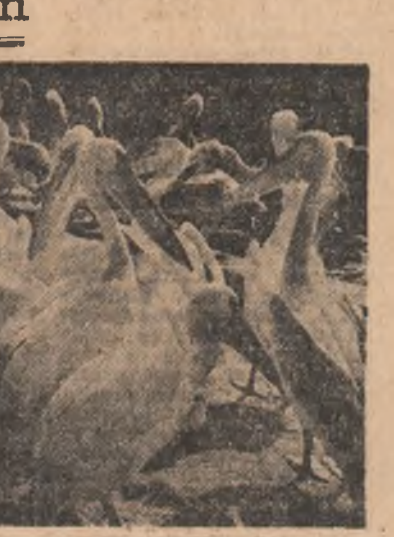
Alo, da', de ce-ați căzut pe gânduri?