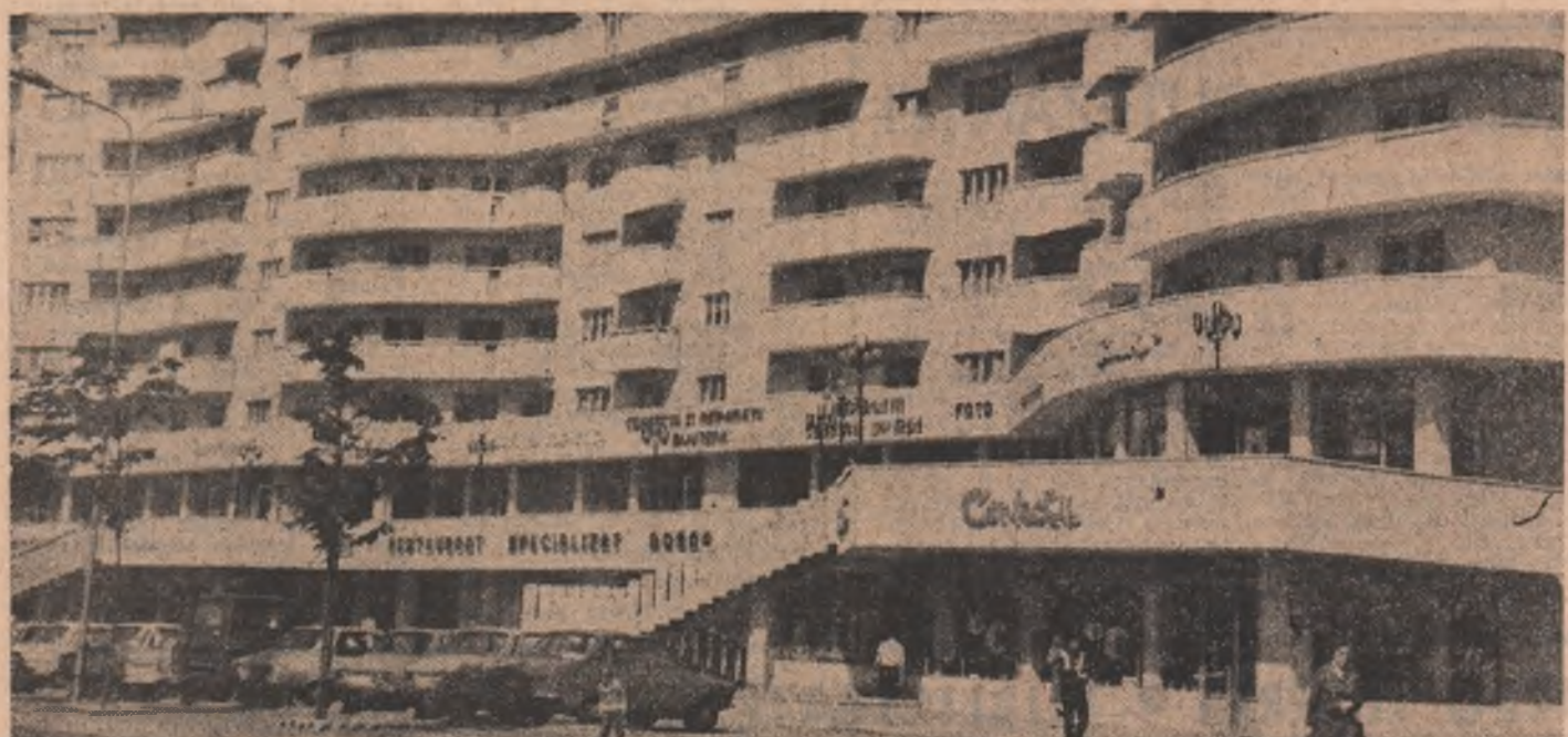
Bulevardul George Enescu din Suceava.

acumulare. Ca urmare, întreprinderea a pus la dispoziția dispenseului energetic național o putere efectiv utilizabilă superioară cu 37,5 Mwh celei prevăzute inițial, concomitent cu diminuarea consumului tehnologic propriu de energie electrică. De menționat că hidroenergienții viteeni au redus, în perioada parcursă din acest an, cheltuielile de producție cu peste 6,5 milioane lei.