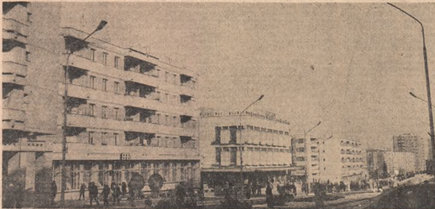
Imagine din centrul Vasluiului