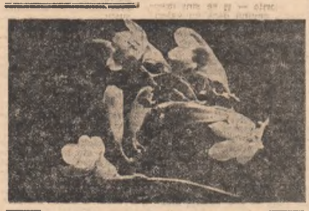
Și se nu uităm că sintem în luna cadourilor. Deci, pentru cîntăreați bîntîci noastra, acest buchet de frezii!