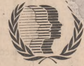
Internationales Jahr der Jugend 1985