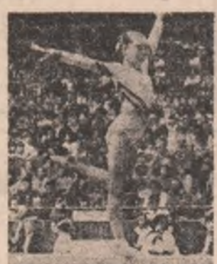
DANIELA SILIVAS, o nouă stea din consiliația de aur a gimnasticii românești, o nouă campioană a lumii, o nouă urmasă a Nadiei Comăneci