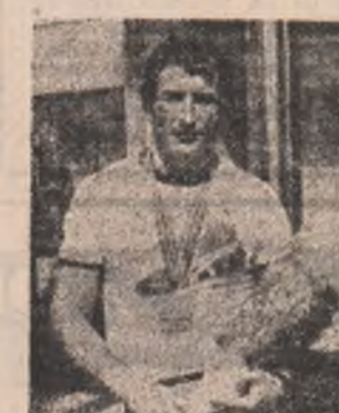
ȘTEFAN NEGRÎȘAN, nume de rezonanță în elita luptelor greco-romane, campion mondial și reprezentant de frunte al școlii românești de lupte