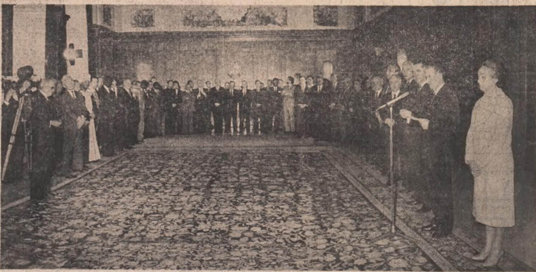
economico-socială, pentru a-și împlini visurile și dorințele de o viață mai bună, liberă și independentă. Iată de ce am început și închei cu necesitatea de a face totul pentru pace.

viața internațională, dar, după părerea noastră, problemele păcii și dezarmării, ale noului ordin economic mondial sunt cele mai arzătoare problemele care Jupiterii climatului relațiilor pe plan internațional. Sintem hotărâți să acționăm și în continuare și să luăm totul pentru a colozare, cu toți aceia care doresc o omenire să trăiască în pace, ca fiecare națiune să fie liberă și independentă. În ce privește România, ați trăit și trăiți, de un timp mai lung sau mai scurt, împreună cu noi. Cunoașteți și ce am realizat, și ce mai avem de făcut, și ce ne-am propus pentru anul viitor și, în perspectivă, până în '90 și chiar până în anul 2000. Cu toate condițiile grele economice mondiale — și, mai cu seamă, politice — și în anul care îl încheiem, în cincinalul 1981—1985, am obținut o serie de realizări importante. Ne-am propus, în noul an și în cincinalul 1986—1990, să parcurgem o etapă nouă în dezvoltarea forțelor de producție, în ridicarea gradului de civilizație, a bunăstării poporului, în întărirea independenței și suveranității țării. Avem condiții să realizăm toate acestea. Avem însă nevoie de pace. Avem poporul român, și toate popoarele au nevoie de pace pentru a-și putea realiza programele și planurile lor de dezvoltare