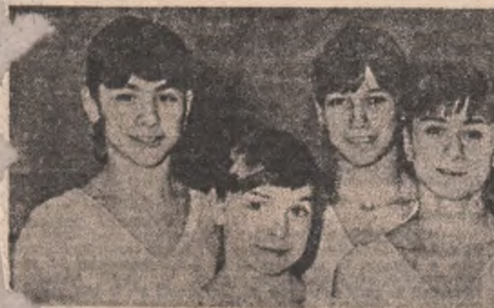
A FEMININĂ DE GIMNASTICĂ A ROMÂNIEI, vicecampionă mondială, a pîșit, la Montreal, pe drumul de glorie al gimnasticii noastre. Felicitări pentru debut și succes mai departe!