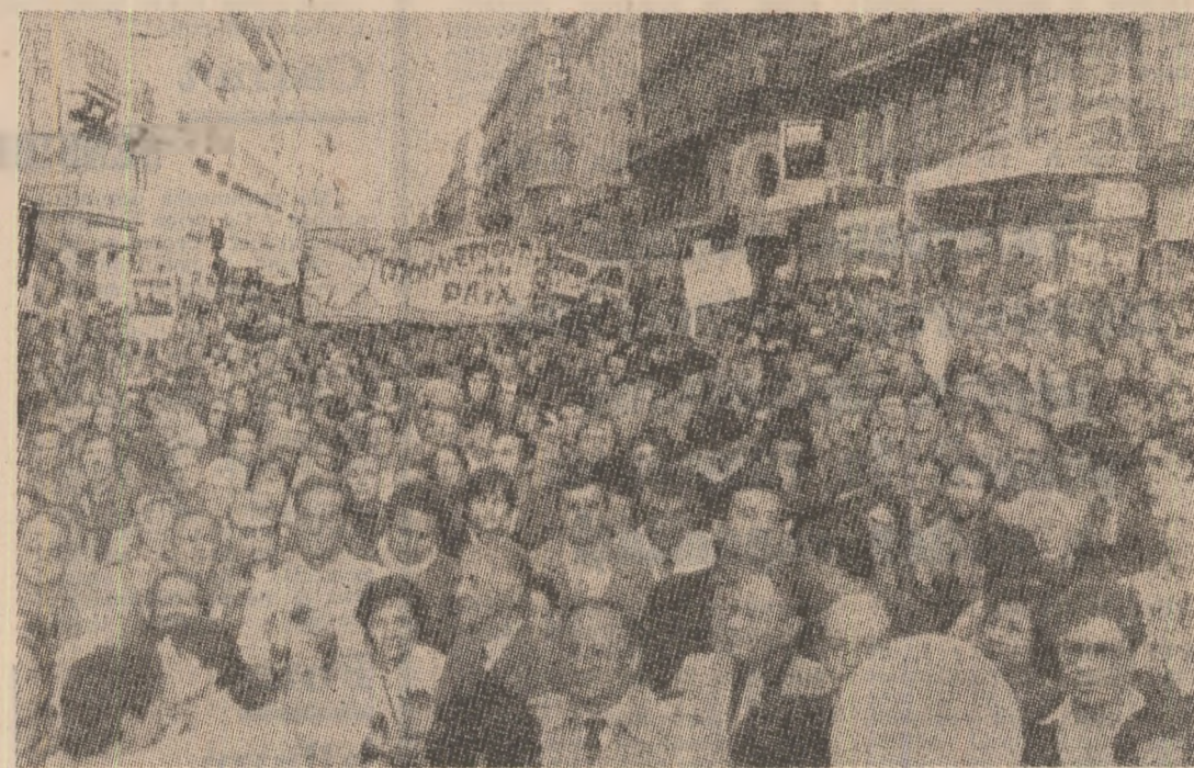
Numeroși participanți au demonstrat la Paris în favoarea păcii, pentru oprirea cursei înarmării, în primul rând a înarmărilor nucleare

montană Metn, aflată în apropierea capitalei. BAGDAD 13 (Agerpres). — Sub președinția lui Yasser Arafat, președintele Comitetului Executiv al Organizației pentru Eliberarea Palestinei (O.E.P.), la Bagdad au început luni lucrările unei reuniuni comune a Comitetului Executiv al O.E.P., Comitetului Central al „Al Fatah”, principala componentă a O.E.P. și Consiliului Național Palestinean (parlament), înfățișând agențiile I.N.A. și T.A.P. În prima sesiune au fost examinate ultimele evoluții în problema palestiniană, precum și acțiunile politice ale organelor conducătoare palestiniene în perioada de la ultima reuniune comună de la Bagdad.