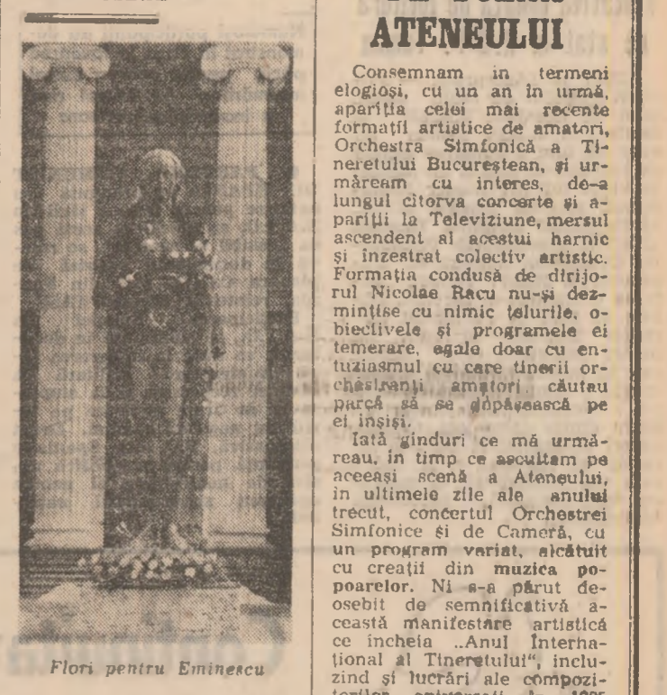
Flori pentru Eminescu