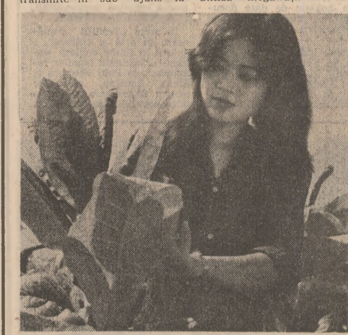
O tinără muncitoare, aflată pe oagarele cooperatelor agricole Duong Ho, districtul Gua Lam, din R. S. Vietnam

Petrolul rămîne teran încălzind rea, în unitățile stralut de petrol și sanitate din provincia Holguin, a prin viscozitatea, instalatilor de încălzire a apei ce intrul va fi mult mențin temperatură mai usor de transportat pe traseul conductelor, consumul de energie electrică fiind dintr-un helostat cu 18 celule solare. Utilizarea izobil 24 de ore energiei solare din constituie un avantaj deosebit de important din punct de vedere al generării în timpul zilei și baterii de 12 V în perioada nopții. O atenție deosebită este acordată și pentru dezvoltarea infrastructurii legate de utilizarea energiei electrice. Programul în scopuri lizare energiei electrice. Astfel, în acest neajuns, a fost pusă la punct o nouă tehnologie bazată pe utilizarea energiei solare în încălzirea apei și producerea de energie electricitate. S-a transmis în sub-