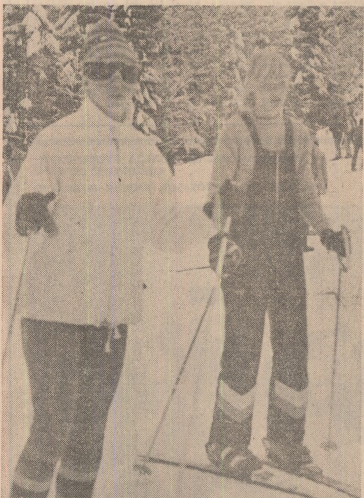
Rubrica: ÎN DIRECT, VACANȚA! (PAGINA A IV-A)