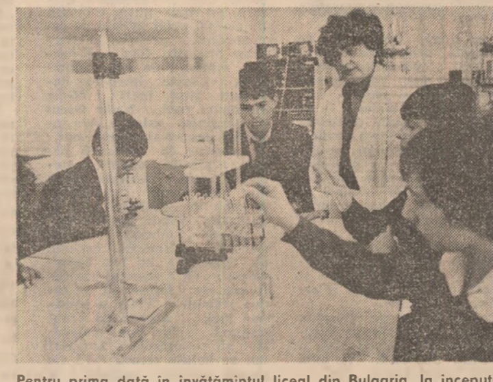
Pe prima dată în invatămîntul liceal din Bulgaria, la începutul anului școlar în curs a fost înființat complexul de studii și cercetări în domeniul biotehnologiilor. În imagine, aspect din timpul unei ore de laborator la Liceul „Acad. L. Ciaccolu” din Sofia

CAIRO 15 (Agerpres). — În cursul întîlnirii pe care președintele italian Bettino Craxi a avut-o cu președintele Egiptului, Hosni Mubarak, s-a apreciat că cea mai bună cale de combatere a terorismului constă în intensificarea eforturilor vizînd reglementarea pasnică a situației din Orientul Mijlociu.