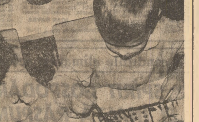
de la Biroul de studii zootehnice și medicale veterinare.