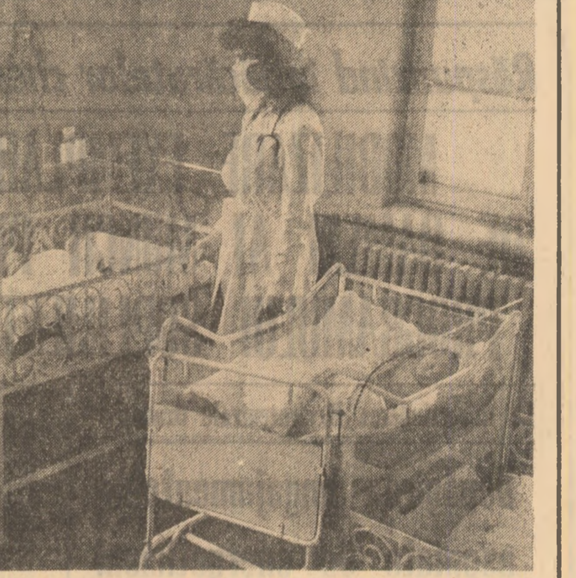
Maternitatea „Steaua” din Capitală.