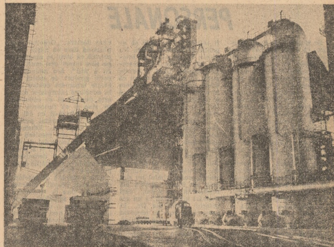
Combinatul siderurgic Galați.

noi succese și de prosperitate poporului român prieten. În cuvîntarea prezentată cu acest prilej de ambasador este subliniată importanța deosebită pe care au avut-o, în dezvoltarea raporturilor de prietenie dintre țările noastre, vizitele oficiale la nivel înalt, care au creat posibilități largi pentru extinderea și întărirea cooperării în diverse domenii și au deschis perspective pentru aprofundarea acestora în noi sectoare de interes reciproc. Este pusă în evidență poziția constructivă adoptată de România față de reglementarea pe