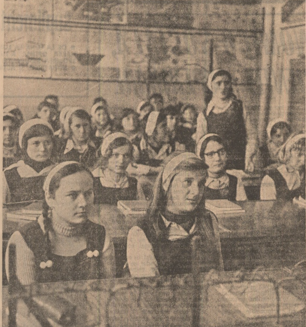
Liceul agroindustrial din Sîmleu Sibiului