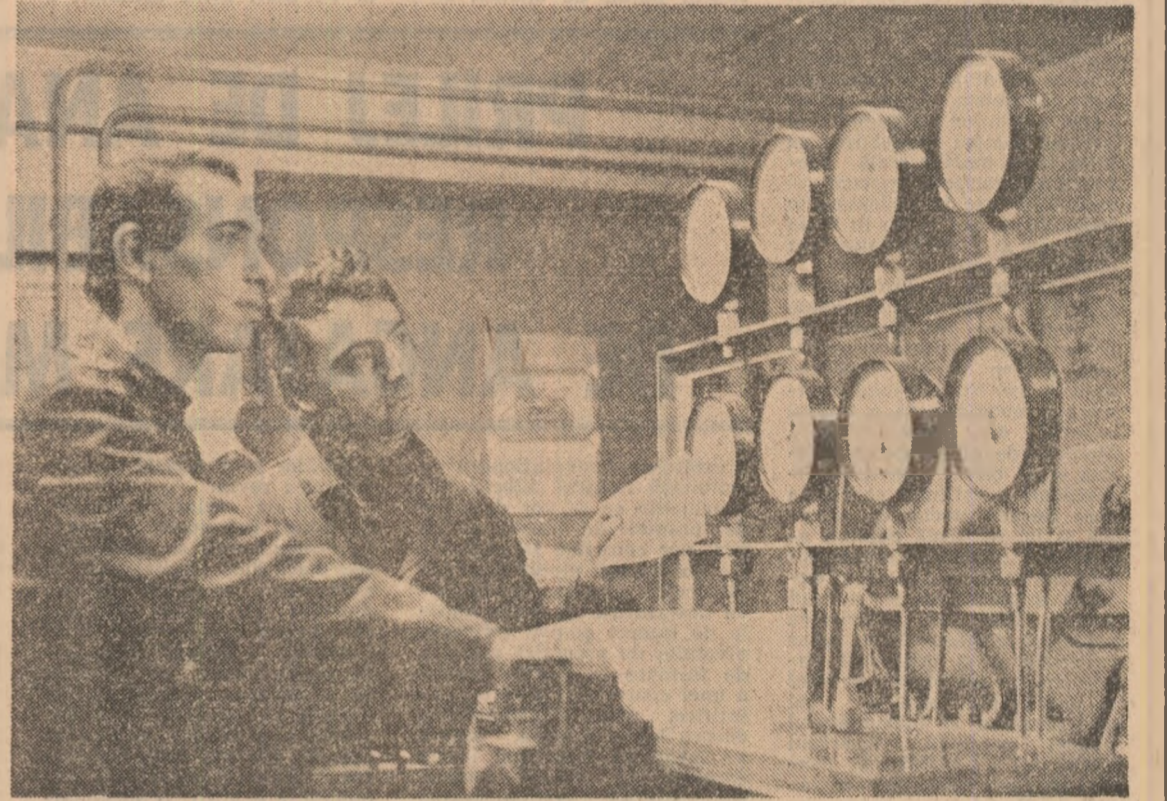
I.M.M.R. Grivița Roșie

ai muncii. Un exemplu edificator în această direcție ni-l oferă Întreprinderea de Alumină Oradea, unitate preocupată constant de introducerea și generalizarea noilor tehnologii de fabricație, valorificarea superioară, complexă a materiei prime și materialelor specifice, diversificarea continuă a gamei sortimentale realizate.