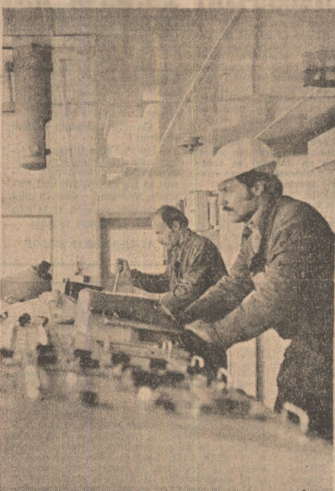
Santiurul Naval Brăila