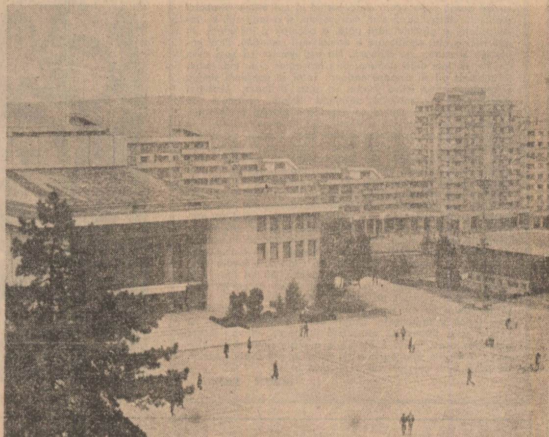
Casa de cultură a sindicatelor din Pitești

varea științei în activitatea economico-socială se asociază cu promovarea tehnicii celei mai înaintate, așa cum sînt ele afirmate în revoluția științifico-tehnică contemporană. Dezvoltarea intensivă presupune accesul liber în viața economico-socială al ciberneticii, automatizării, robotizării, al tehnologiilor avansate care permit realizarea de produse cu performanțe superioare. Etapa în care ne aflăm solicită fiecare să ne întrebăm cu maximă răspundere revoluționară și patriotice ce anume producem?, cu ce pret?, ce