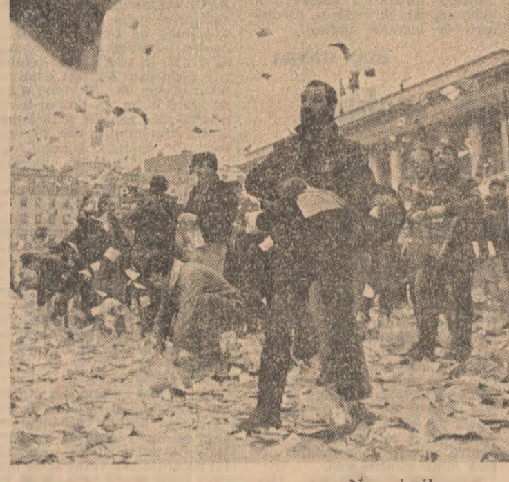
Negocierile sovieto-americane de la Geneva

Etimologic, cuvântul diplomatie vine de la grecescul diplōo care înseamnă dubluri și se referă la acțiunea de a redacta actele oficiale sau diplomele în două exemplare. Unul era dat ca scrisoare de impunitărie sau recomandare trimisilor, iar celălalt se păstra în arhivă. Posesorul unui asemenea act a fost numit diplomat, iar activitatea desfășurată de el diplomație. De la grecii antic, cuvântul a fost preluat apoi în latină și în vocabula politică. În etapa contemporană, diplomația este asociată cu eforturile statelor de a regla litigiile și conflictele dintre ele, de a-și apăra și promova interesele pe calea tratatelor. Diplomația este o formă distinctă a raporturilor bilaterale și multilaterale dintr-o stare, caracterizată prin căutarea, prin intermediul negocierilor, unei armonizări a intereselor acestora. În această viziune, vocația diplomației rezidă din asigurarea bunăstării popoarelor, menținerea unor relații pacifice, de cooperare și de înțelegere între ele, cu respectarea personalității fiecărui stat și popor. În măsură