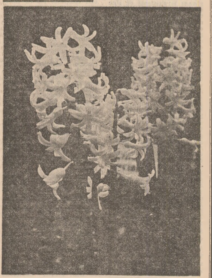
„Fire” care leagă 1 cu 8 Martie...