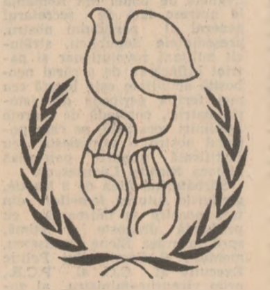
Logo pentru activitatea socială a femeilor din Iugoslavia, care a avut loc la Belgrad.

Mildenhalle — comitatul Suffolk — a fost organizată o demonstrație de protest împotriva prezentei militare a Statelor Unite în Marea Britanie. Participanții la această acțiune — organizată de Mișcarea pentru dezarmare nucleară, cea mai largă organizație antirăzboinică din Anglia — au cerut lichidarea acestor baze americane. La locul manifestației au fost trimise forțe polițienesti care au arestat 30 de persoane.