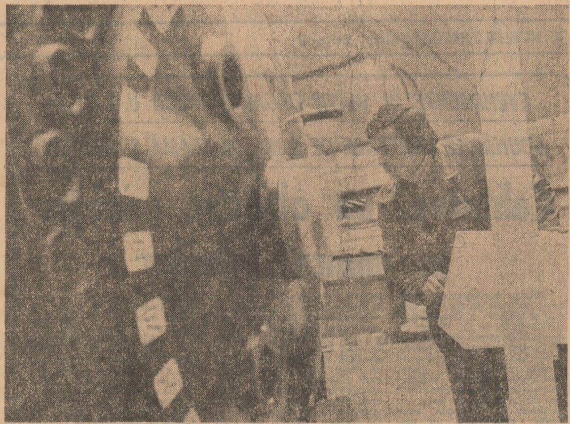
Întreprinderea de elemente pneumatice pentru autoturisme

ANUL XLII SERIA II Nr. 11 441 4 PAGINI 50 BANI VINERI 14 MARTIE 1986