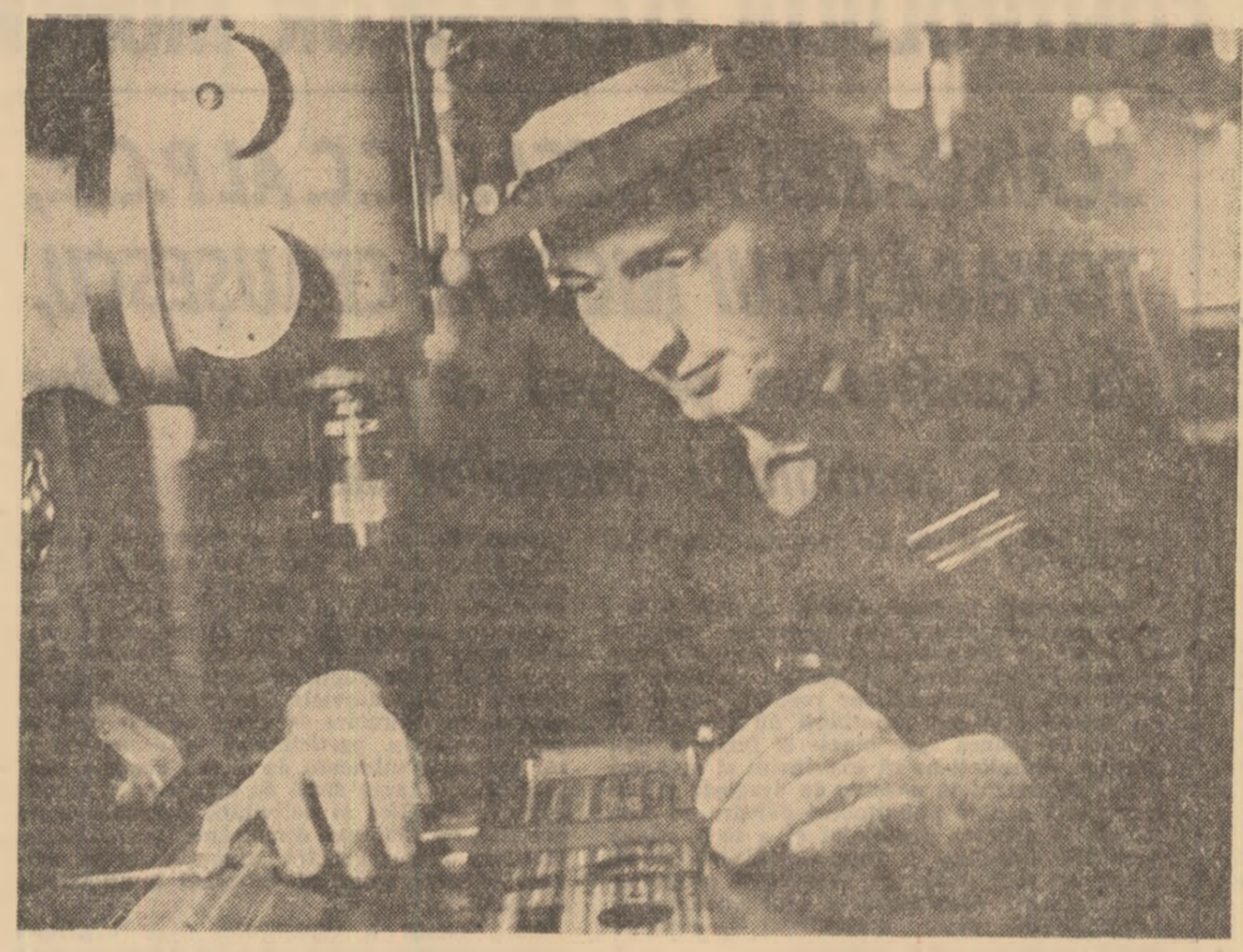
La Întreprinderea de Motoare Electrice Pitești