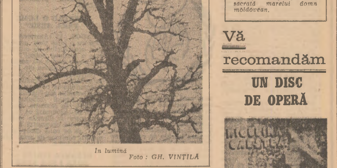
In lumină