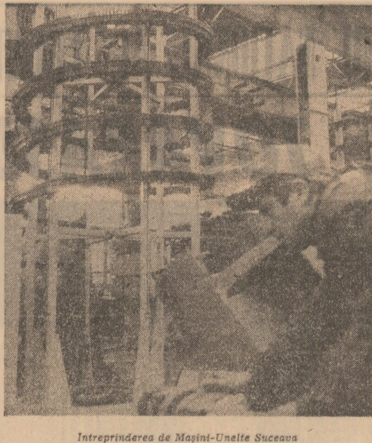
Întreprinderea de Mașini-Unelte Suceava