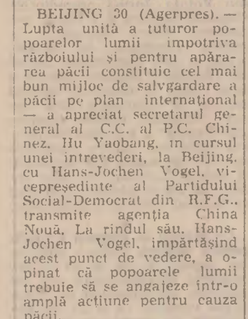
BEIJING 30 (Agerpres) — Lupta unită a tuturor popoarelor lumii împotriva războiului și pentru apărarea păcii constituie cel mai bun mijloc de salvagardare a păcii...