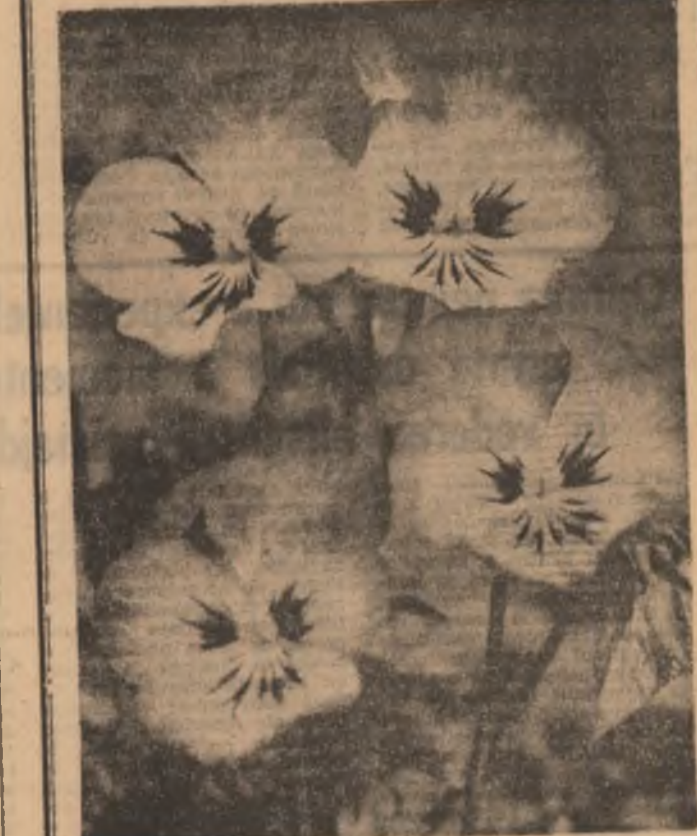
Tinerii, prin acțiunile lor de înfrumusețare a parcurilor, grădiniștilor și arterelor de circulație, contribuie la răscăderea și primăverii. Primele flori pe care le înădădăsc simt... pansulele.