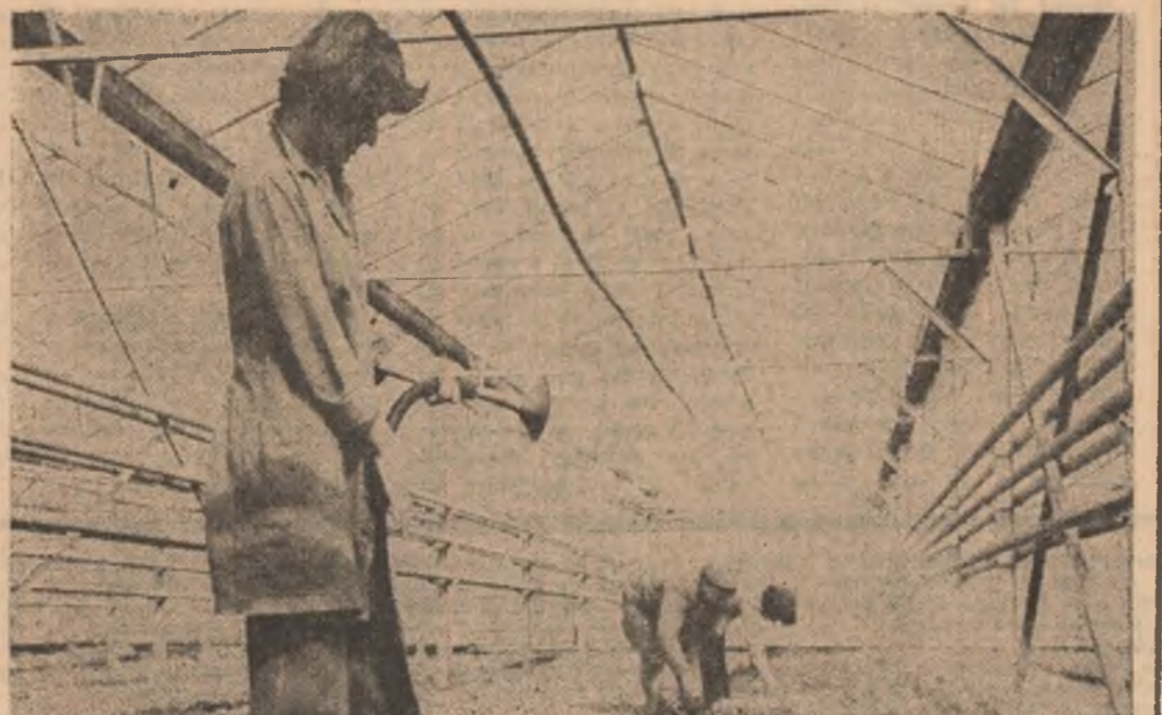
Relatoz în pagina a V-a

Pe măsura ce au terminat efectuarea celorlalte lucrări agricole de sezon. Astfel, se depun eforturi susținute pentru înfăptuirea rapidă a însămînțării soiilor pe ultimele suprafețe plantificate, a fasolei în ogor propriu, pentru plantarea și însămînțarea legumelor în câmp. De asemenea, se acționează la întreținerea culturilor, erbicidarea cerealelor păioase de toamnă, la efectuarea lucrărilor specifice din viticultură și pomicultură, curățirea și amestecarea pășunilor, însămînțarea plantelor de nutreți. Din ultimele date puse la dispoziție de ministerul de resort, rezultă că pînă în seara zilei de 22 aprilie, legumele au fost plantate și semănate pe 45 la sută din suprafața stabilită. Cu realizări de peste 60 la sută din prevederi se înscris unitățile agricole din județele Cluj, Mureș, Brașov, Harghita, Bistrița-Năsăud, Neamț, Iași, Vaslui, Bihor, Mehedinți, Giurgiu, Sectorul Agricol Ilfov. De menționat că unitățile agricole cultivate din județul Covasna nu termină această lucrare. Este necesar ca în aceste zile, Corpurile forțe umane și mecanice să fie mobilizate la coordonarea însămînțării pe suprafețele rămase, a năvălirii deosebit de urgentă a calității lucrărilor, respectării cu strictețe a tehnologiei fiecărei culturi. În vederea obținerii unor recolte mari în acest an.