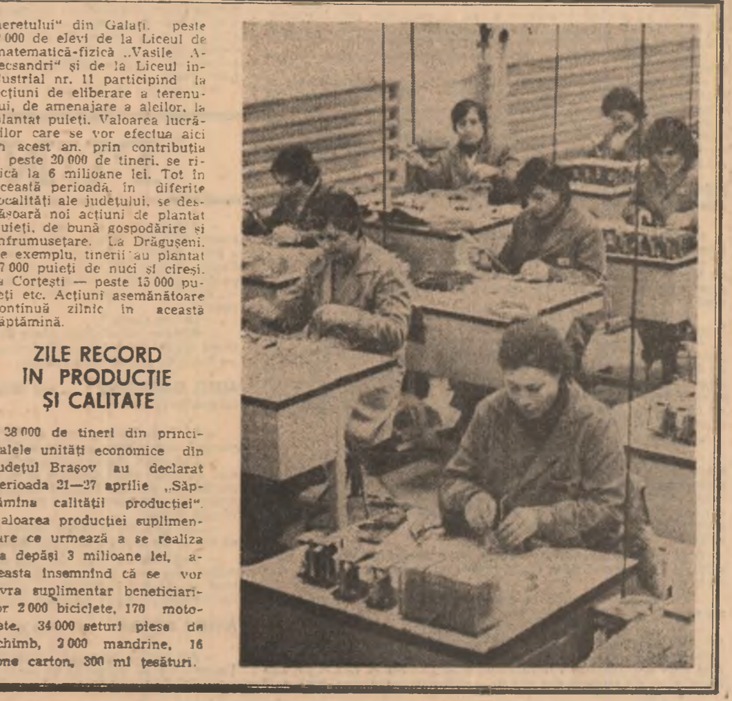
ZILE RECORD ÎN PRODUCȚIE ȘI CALITATE

înaltă presiune, 10 tone ciment, 3 tone var, 3 tone ciment, 100 m.p. place)”. RITMUL EXTRACTIEI — LA COTE MEREU MAI ÎNALTE Feste 2000 de tineri din zece unități economice mar-marure-sente vor participa la importantă acțiune de muncă patriotică în sprijinul producției în vederea realizării, peste prevederile de plan, a unui proiect în valoare de peste 500000 lei, concretizată în excavarea și transportul a 70 tone minereu, stivuirea a 330