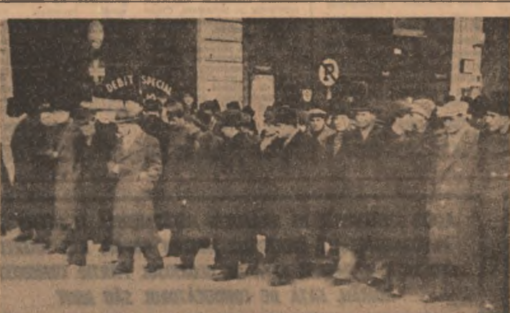
Tovarășul Nicolae Ceaușescu la manifestația prilejuită de încheierea lucrărilor Congresului sindicatelor, ianuarie 1945.