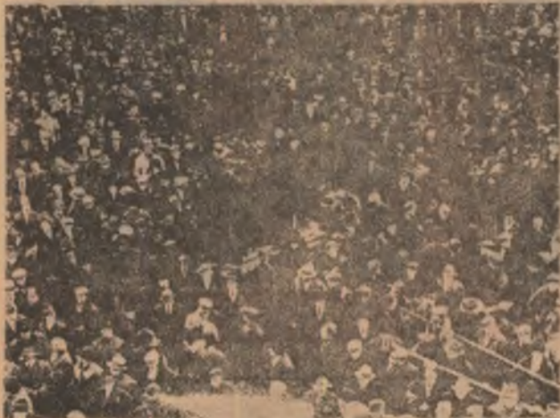
Luptele muncitorilor din România din ianuarie-februarie 1933 au constituit un moment important în apărarea independenței și suveranității țării, fiind primele mari acțiuni revoluționare pe plan mondial după instaurarea hitlerismului la putere în Germania. În fotografie: Muncitori cehoslovaci barcodați în curtea Atelierele „Grivița” din București la 15-16 februarie 1933.

Comitetul Executiv Provizoriu al Partidului Socialist din România Comisia Centrală Provizorie a Sindicatelor din România