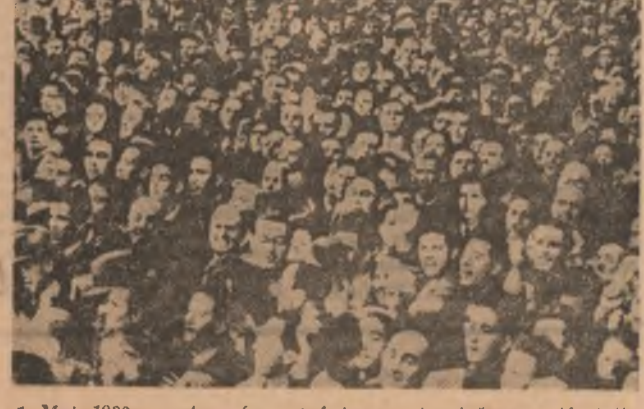
1 Mai 1939 s-a transformat într-o puternică manifestație împotriva fascismului și războiului, numărîndu-se printre primele manifestații din Europa în condițiile cînd jascismul era în ofensivă după Mînchen. În organizarea și desfășurarea marilor demonstrații patriotice, antifasciste și antirăzboinice de la 1 Mai 1939 din București un rol important l-a avut tovarășul Nicolae Ceaușescu, iar din partea organizației de tineret din Capitală tovarășea Elena Ceaușescu.