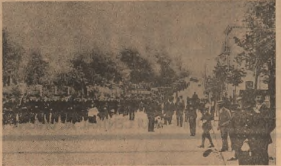
Manifestație sub lozincă „Trăiască social-democrația” organizată de partidul clasei muncitoare din România în anul 1911 în București