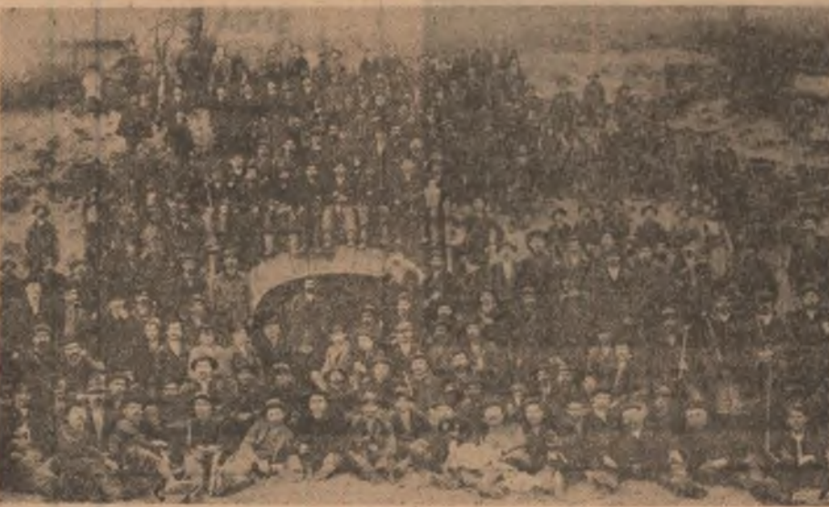
Grup de muncitori feroviari participanți la greva generală de la Atelierele Gării de Nord din București 1888.