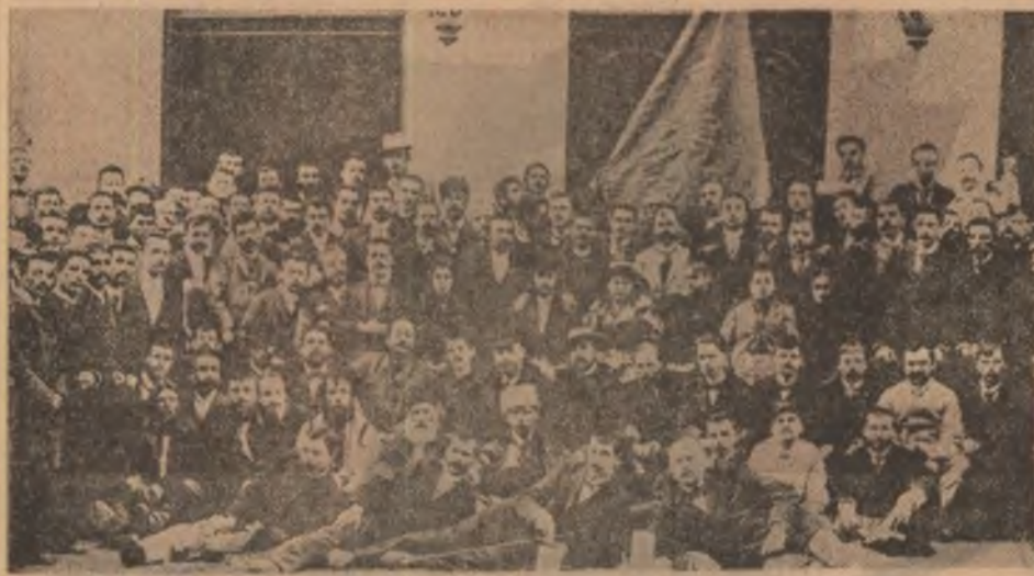
În zilele de 31 martie — 3 aprilie 1893 în sala Clubului muncitorilor din București s-au desfășurat lucrările Congresului de constituire a Partidului Social-Democrat al Muncitorilor din România. În fotografia participanți la cel de-al II-lea Congres al P.S.D.M.R., București, 1894.