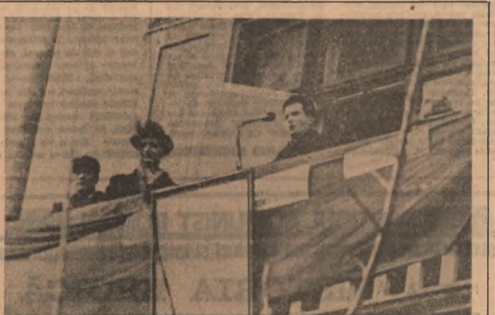
Tovarășul Nicolae Ceaușescu vorbind la un miting la Constanța, 1946.