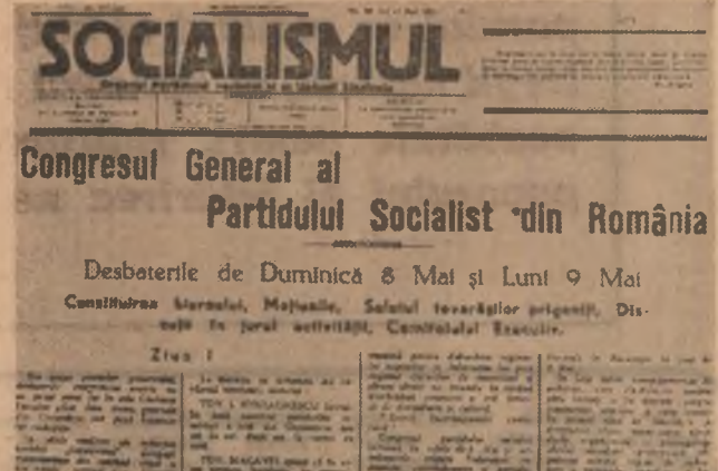
Relație privind desfășurarea lucrărilor Congresului de făurire a Partidului Comunist Român publicată în ziarul „Socialismul”, 12 mai 1921

Făurirea Partidului Comunist Român este rodul unui proces intern avînd cauze fundamentale în viața țării, în situația maselor populare și în sfera aspirațiilor și idealurilor lor. De altfel, însuși programul pe care comunistii și l-au asumat și declarat din chiar prima zi a existenței partidului înscrisea la loc de cinste obiective de luptă în esență măsură socială și națională și tot ceea ce avea să urmeze, ca spirit de luptă și sacrificii, se va înscrie și se va păstra în acest spațiu al înțederii în justetea cauzei comuniste, în posibilitatea realizării practice a idealurilor revoluționare. Partidul Comunist Român a fost și a rămas un partid revoluționar, al cărui membri au pus întotdeauna mai presus de orice interesele muncitorilor, ale celor supuși exploatații și asupririi, ale celor care aspirau la dreptate și erau gata să lupte pentru ea și pentru interesele țării. Mărturiile epocii sînt deosebit de zăvoaie în această privință, iar marile mișcări sociale ale celor ce muncesc, organizate și conduse de comunisti, au rezonanță pe deplin istorică, fac parte organică din tradițiile eroice ale poporului român, în ansamblul său. După cum, energia cu care comunistii s-au ridicat în apărarea libertății, integrității și independenței României amenințate de fascism, de cercuri imperialiste, vine să ateste în aceeași ordine de idei abnegația și devotamentul cu care au știut să ducă lupta pentru idealuri izvoate din necesitățile istorice ale țării, ale progresului ei.