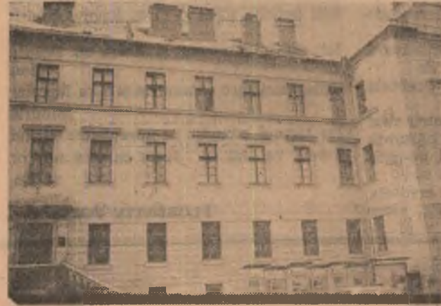
În perioada 27 mai — 5 iunie 1936, la Brașov s-a judecat procesul unui grup de comunisti și antifascisti în frunte cu tovarășul Nicolae Ceaușescu, care a avut o contribuție esențială în transformarea acestei înșelări judiciare într-o tribună de demascare a pericolului fascismului și războiului, de apărare a năzuințelor maselor muncitoare, a intereselor naționale ale poporului român.