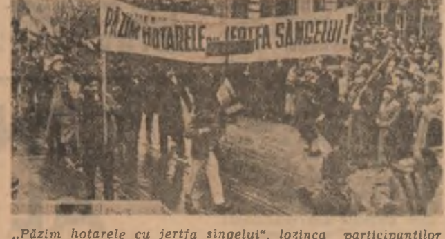
„Păzim hotarele cu jerfa singelui”, lozincă participanților la o mare demonstrație împotriva politicii statelor jasciste de revizuire a hotarelor, București, 1936.