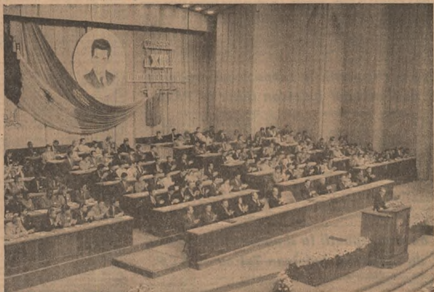
Secretarul general al Partidului Comunist Român, președintele Republicii Socialiste România, tovarășul Nicolae Ceaușescu, adresând tineretului patriei, tinerii generații de pretendenți ai strălucitului mesaj mărturisind grija părintească a conducătorului partidului și statului nostru pentru împlinirea idealurilor și aspirațiilor tinerilor, un mobilizator îndemnat la acțiuni unite pentru un viitor de pace, înțelegere și colaborare, pentru o lume mai bună și mai dreaptă.

Și într-adevăr, viața a validat și validează valabilitatea și viabilitatea opțiunilor fundamentale, a tezelor și orientărilor fundamentale ale politicii externe promovate de partidul și statul nostru, care, în realitate, demonstrează înțelegerea trancienței acestor opțiuni, faptul că ele își trag seva din cunoașterea perfectă a realităților dinamice ale lumii contemporane. Exemplificăm nu fac, la rândul lor, decât să confirme o dată în plus aceste adevăruri. Iată, de pildă, ampla deschidere spre lume a politicii noastre externe. Într-o lume zăvălită de probleme atât de complexe, de mari și acute contradicții, România socialistă, urmind orientările programate trasate de congresele și conferințele naționale ale partidului, a făcut dovada concretă a posibilității de a se instala relații de tip nou între state, de a dezvolta raporturi de prietenie și colaborare cu toate țările lumii, pe baza respectării neabătute a principiilor de drept internațional: egalitatea deplină, independența și suveranitatea națională, neamestecul în treburile interne, avantajul reciproc, renunțarea la forță și la amenințarea cu forța. În acest fel, România socialistă își aduce o importantă contribuție la cauza păcii și înțelegerii pe planeta noastră, la dezvoltarea schimbului de valori materiale și spirituale între națiunile lumii.