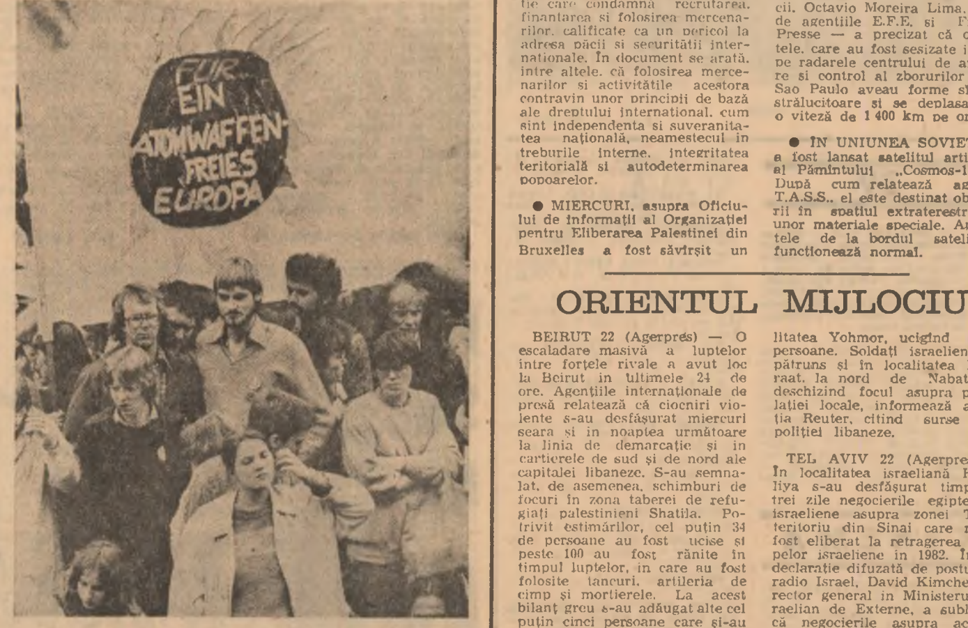
Grupaj realizat de TUDOR PRÉLIPCEANU

Nouă din zece australieni în vîrstă de la 18 la 24 de ani resping programul american „Inițiativa de Apărare Strategică” constînd în sondaj de opinie organizat de ziarul „Sydney Morning Herald”. Cei care se pronunță cel mai ferm împotriva acestui program, cunoscut sub numele de „răz-