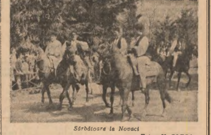
Sărbătoarea la Novaci