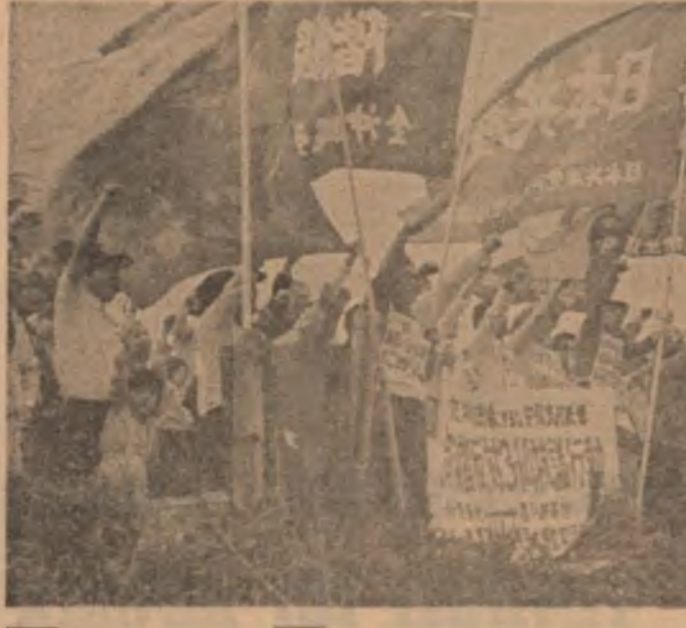
JAPONIA — Imagine din timpul unei ample demonstrații a participanților pacii din Okinawa...