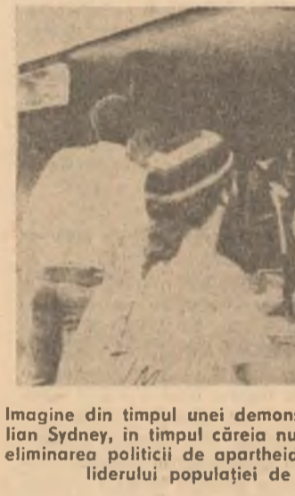
Imagine din timpul unei demonstrații desfășurate în orașul austriac Sydney, în timpul căreia numeroși tineri s-au pronunțat pentru eliminarea politicii de apartheid practicate de R.S.A. și eliberarea liderului populației de culoare, Nelson Mandela

Paris. După cum relevă agenția Reuters, participanții la această demonstrație de protest împotriva politicii de apartheid promovate de regimul rasist de la Pretoria și au cerut eliberarea lui Nelson Mandela, lider al Congresului Național African, interzicte de către autoritățile sud-africane de peste 20 de ani.