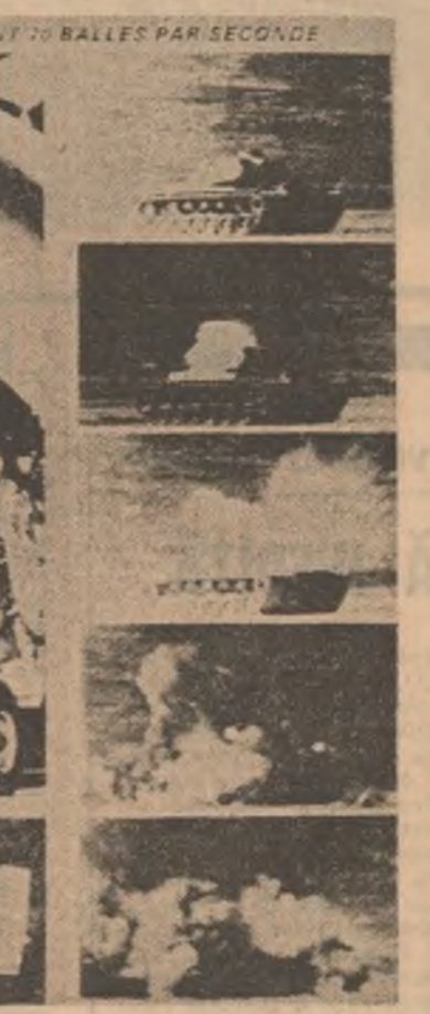
Orice tanc, indiferent de grosimea blindajului, poate fi distrus în câteva secunde cu ajutorul mitralierei grele cu proiectile din uraniu, așa cum apare în publicitatea franceză „Science et vie”

Bionica este, după cum se știe, știința care studiază învențiile naturii, pentru a le aplica în domeniile industriale și militare, tot așa cum aviația militară s-a dezvoltat din imitația zborului păsărilor. Experții militari americani au acordat în ultimul timp o deosebită atenție bionicii. Inițiativa de zborul ei silențios, specialiștii americani au constatat că el se datoră penajului foarte fin al acestei păsări. La ora actuală, ei pun la punct un avion-spion, acoperit cu un strat fin de nylon, capabil să zboare fără să producă nici un zgomot. Pornind de la faptul că în zborul păsărilor se dirijează fără cîrmă, numai prin modularea aripilor, N.A.S.A. și firma „Boeing” au pus de cîrmă la punct programul M.A.W. — Mission Adaptive Wing: aripi avînd curbura variabilă, din fibră de sticlă, care se modifică automat cu ajutorul ordinatului aceluși înțeles adaptîndu-se la condițiile de zbor. Dar pentru forțele militare americane un verticabil câmpion al campionilor ramblei delphin, datorită rapidității sale — 61 kilometri pe oră (ca și un portavion). Or, recent s-a descoperit că pielea acestui mamifer prezintă o textură sub formă de bastonase minuscule elastice, care joacă rolul de amortizoare, reducînd formarea de vibrații. După acest model, o firmă americană a pus la punct Lamiflexul, o piele de delphin artificială, care de acum înainte va căptuși