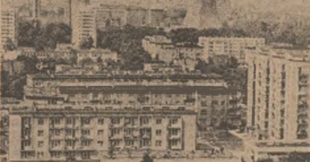
R. P. POLONĂ: Construcții noi, moderne, în orașul Lodz

SOFIA 4 (Agerpres). — La Sofia s-a deschis cel de-al XVII-lea Tîrg internațional de carte la care participă edituri din 50 de țări. Tîrgul nostru este prezentat cu un stand de carte, care include peste 300 de titluri. La loc de cinste se află lucrări din zindirea social-politică și economică a prezidentului Republicii Socialiste România, tovarășul Nicolae Ceaușescu. Sînt prezentate, de asemenea, lucrările tovarășei academi-