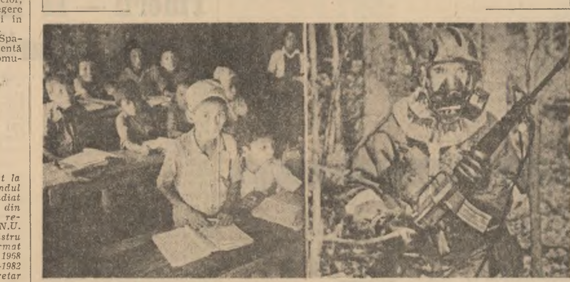
Pentru echiparea unui soldat se cheltuiesc fonduri de 80 de ori mai mari decît pentru instruirea unui copil

Strădania neobosită a României, a tovarășului Nicolae Ceaușescu pentru reducerea cheltuielilor militare, pentru trecerea la măsuri concrete de dezarmare, în primul rând de dezarmare nucleară, își află puternice temeiuri în înseși realitățile epocii noastre, caracterizată prin escaladarea la rîmări și niveluri critice fără precedent a armamentului și înarmării.