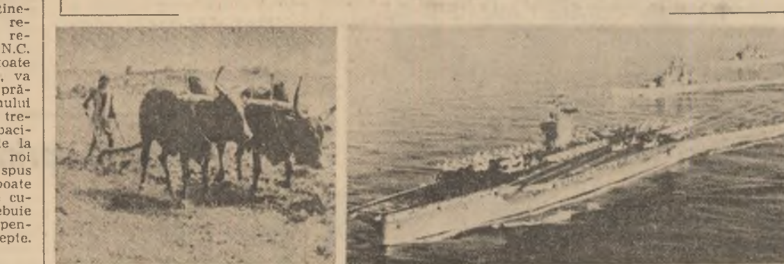
Un portavion înghite costul alimentelor ce sînt necesare pentru 2 milioane de copii pînă în anul 2000

LUSAKA 9 (Agerpres). — Luind cuvîntul la televiziunea zambiană, președintele Congresului Național African (A.N.C.) Oliver Tambo, a chemat întreaga comunitate neagră din Republica Sud-Africană să participe la greva generală ce ar urma să fie declanșată pe întreg teritoriul sud-african în ziua de luni, a.c. în vederea comemorării victimelor de acum 10 ani de la Soweto, din timpul marșilor demonstrații a tineretului studios de culoare, reprimată sîngeros de poliția republicană.