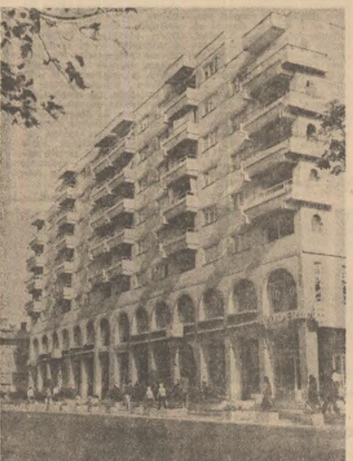
Găești — Județul Dimbovița