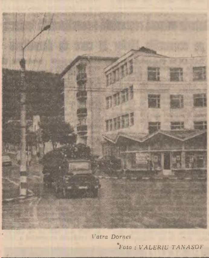
Vatra Dornei