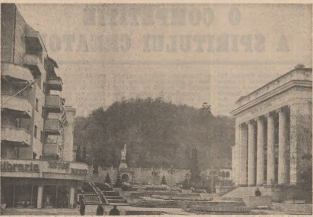
Rimnicu Vilcea