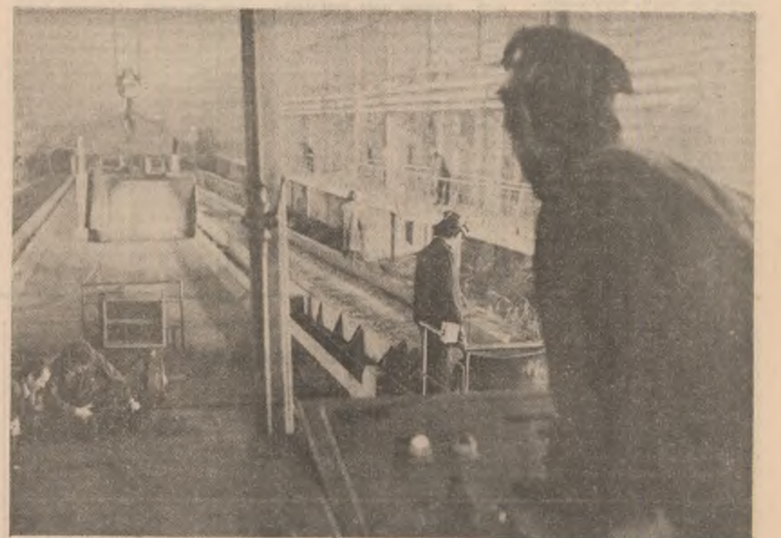
Întreprinderea de Sirmă și Produse din Sirmă Bușu

Frunta în întrecerea socialistă între colective de silicioși de pe platforma Combinatului Siderurgic Galați, colectivul concerel a realizat suplimentar în prima decadă a lunii curente alte 1 000 tone coacă metalurgică de bună calitate. De subliniat că de la începutul anului și până în prezent, ca urmare a folosirii la înalt parametri a bazei lor de calcinare, precum și prin aplicarea unor eficiente soluții tehnice, au fost elaborate suplimentar peste 31 milioane coacă metalurgică.