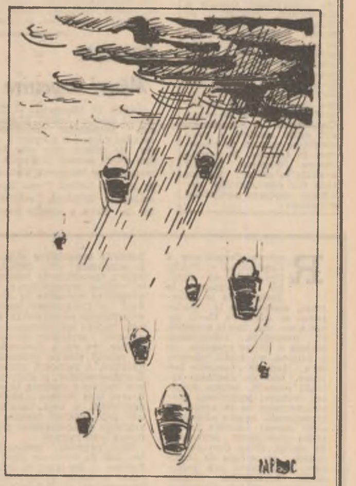
Plouă cu găteala!