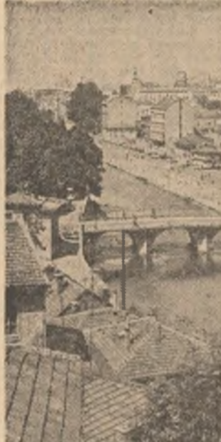
R.S.F. IUGOSLAVIA: Imagine din orașul Sarajevo