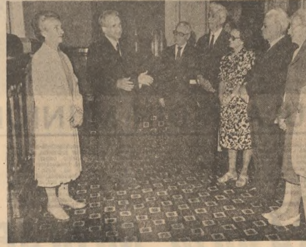
Întâlnirea cu un grup de membri ai partidului cu stagiu din ilegalitate. În fața lor stă secretarul general al Partidului Comunist Român, tovarășul Nicolae Ceaușescu, și tovarășa Elena Ceaușescu.

Tovarășul Nicolae Ceaușescu și tovarășa Elena Ceaușescu s-au întâlnit, la sediul comitetului județean de partid, cu un grup de membri ai partidului cu stagiu din ilegalitate. Într-o atmosferă emoționantă, cei prezenți au ținut să exprime tovarășului Nicolae Ceaușescu profunda satisfacție pentru această întâlnire, care le-a permis să transmită omajii fierbinți ai membrilor de partid cu stagiu din ilegalitate, să-și mulțumească din adânc inimii pentru grija permanentă pe care o poartă dezvoltării județului Brașov, a întregii țări, fericii și prosperității tuturor cetățenilor patriei.